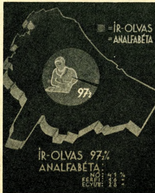
Budapest általános műveltsége

Mit tudunk Budapest utcáinak, utainak, tereinek fáiról? Pedig hány költő énekelt meg őket és mennyi városházi és hírlapi vita folyt körülöttük! Nyáron huszonöt fokos melegben a Rákóczi-úton vagy a Vámház-körúton, vajjon felkiáltott valaha is valaki ilyenformán: milyen hűs árnyékot is adnak ezek a juharlevelű platánfák? Vagy firtatta-e valaki, hogy a Ferenc-kör-úton vagy az Andrásy-úton amerikai ostorfák hajtanak virágot minden tavaszkor és még télen is láthatók sötétbarnás bogyoik. Hát igen, tessék megtanulni, hogy a pesti oldal uralkodó fája a juharlevelű platánfa, viszont a budai utcák, utak jellegzetes fája: a vadgesztenyefa vagy bokrétafa. Ezekén kívül van még: jókori juharfa, amerikai ostorfa, akác, bálványfa és trombitafa. Együttesen 125.000 sorfa szegélyezi fővárosunk utcáit, utait és tereit. Ha egy egyenes út mellé két sorban, 8 méternyi távol-