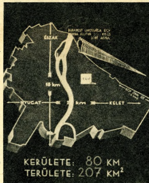
Budapest Nagy Város

ságban ültetnők őket, a fasornak az adriai Polánál lenne a vége.