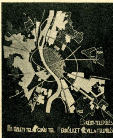
Budapest gazdasági övezetei

Mennyi érdekes történelmi háttérű elnevezésre és utcanevre buk-