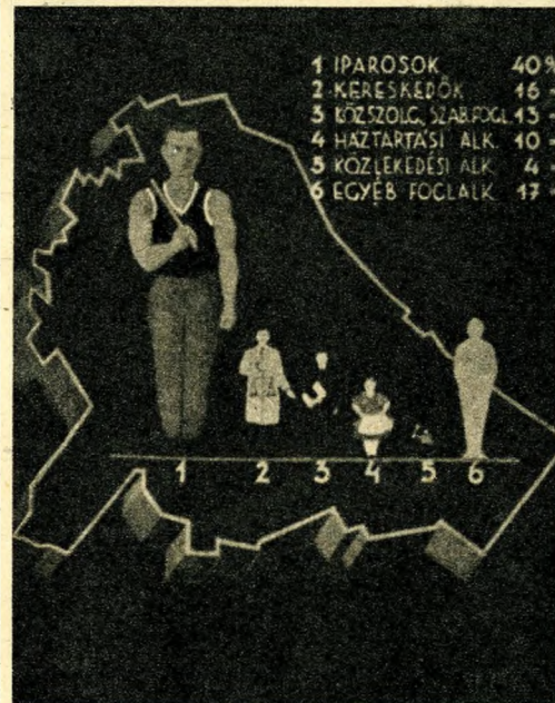
Budapest lakosságának foglalkozása