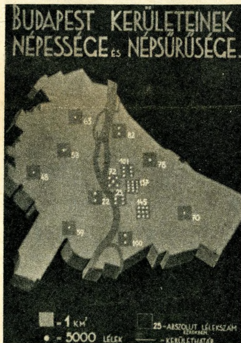
Budapest kerületeinek népessége és népsűrűsége

Pest alföldi település, Buda viszont alacsonyabb hegyvidéki. Pest 100 méter szinten fekszik, Buda viszont 520 méterig is emelkedik, igaz ugyan, hogy a Svábhegyen fe-