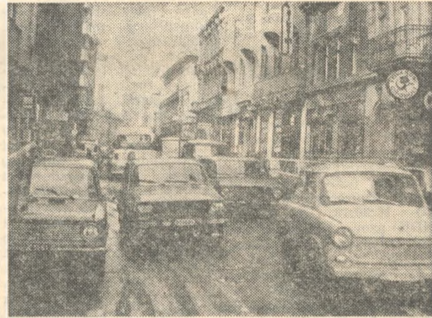
A mindig zsúfolt Dohány utca

A tennivalókat illetően az OKBT plenáris ülése úgy foglalt állást, hogy a fő feladat az emberelutestek számának csökkentése, a halálos balesetek megelőzése. Ennek érdekében tovább kell szélesíteni a partnerkapcsolatot a járművezetők és a gyalogosok között.