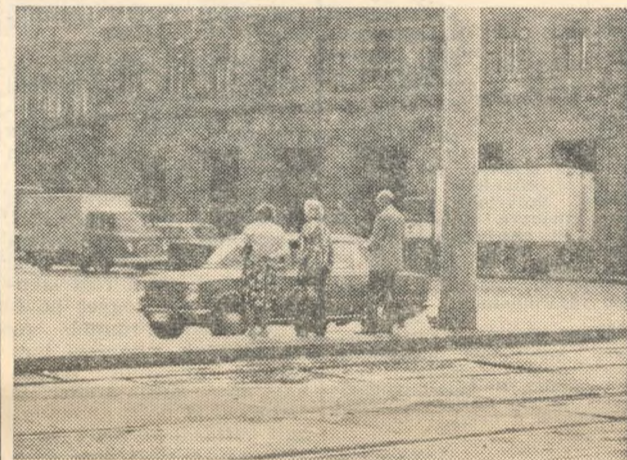
Lelépünk, ne lépünk?...