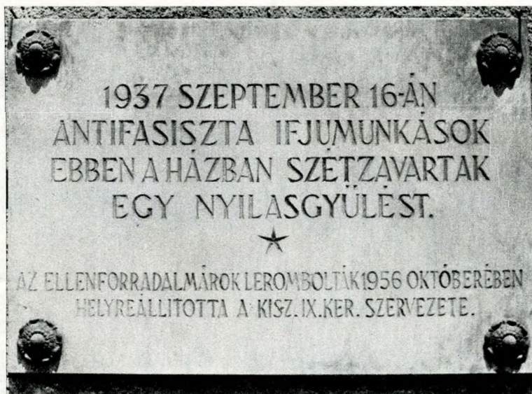
A házon levő emléktábla