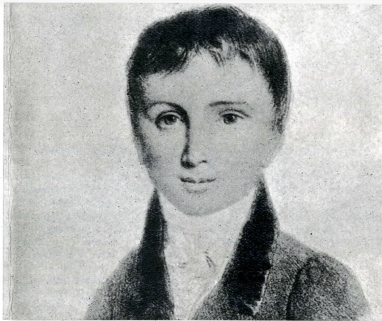
Liszt Ferenc 1823 körül

1823 áprilisának vége felé Pest és Buda házain falragaszok jelentek meg, amelyek így kezdődtek: „Magyar vagyok és nem ismerek nagyobb boldogságot, minthogy nevelésem és taníttatásom első zsengeit . . . ragaszkodásom és hálám jeléül első áldozatként drága Hazámnak bemutatam . . .” Az aláírás: Liszt Ferenc. A művész alig múlt 11 éves, és első hazai szereplésére, a Hétválasztóban tartandó hangversenyére hívta meg a közönséget. A siker nagy volt, a kritikák kitűnőek: „. . . a szép szóke ifjatska olly ügyességet, könnyűséget, pontosságot, érzést mutatott, hogy az egész nemes gyülekezetet bámulatra ragadá” – olvasható a Hazai s Külföldi tudósítások 36. számában megjelent cikkben. Bártfai László naplójában írja, mily tökéletesnek találja Liszt játékát: „. . . akkor kénytelen valék hinni, hogy lehetetlen már haladnia . . .” Talán ez a hangverseny volt az akkor majd százéves fogadó legszebb estéje. És Liszt nemcsak nyújtott, nyert is élményt. Itt hallott először nagy cigányzenekart (Boka Andrásét) játszani. Később Bihari János, a verbunkos-zene szerzője lett Liszt kedvenc primása. Leírta, milyen „csodálatos hangzhatagokat csalt ki hegedűjéből”, és „mily hatalmas hatást gyakorolt” Bihari. Az már szomorúbb emléke a Hétválasztónak, hogy itt árverezték el a híres primás hegedűjét, halála után egy évvel, nyomorgó özvegye javára . . .