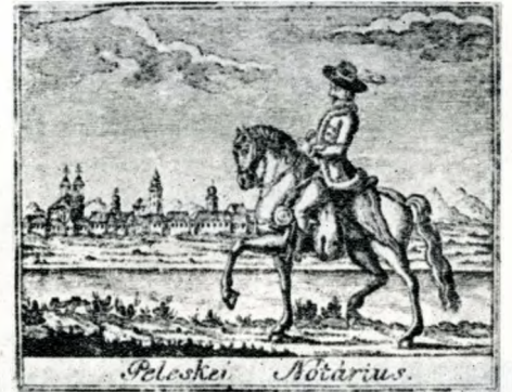
Gvadányi József Peleskei nótáriusának címlapja