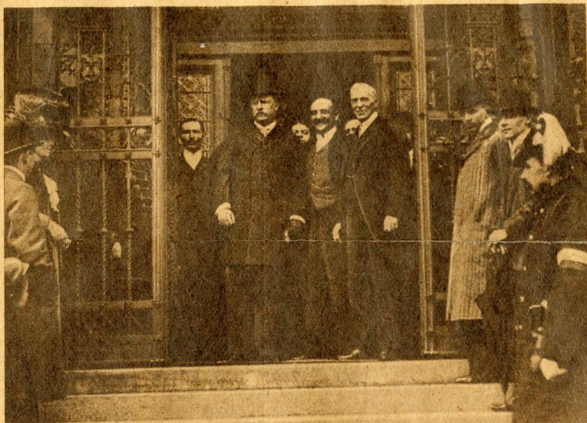
Roosevelt Tivadar, az Egyesült Államok egykori elnöke, budapesti látogatása alkalmából.

Ferdinánd és Milán főként szórakozni jártak Buda-