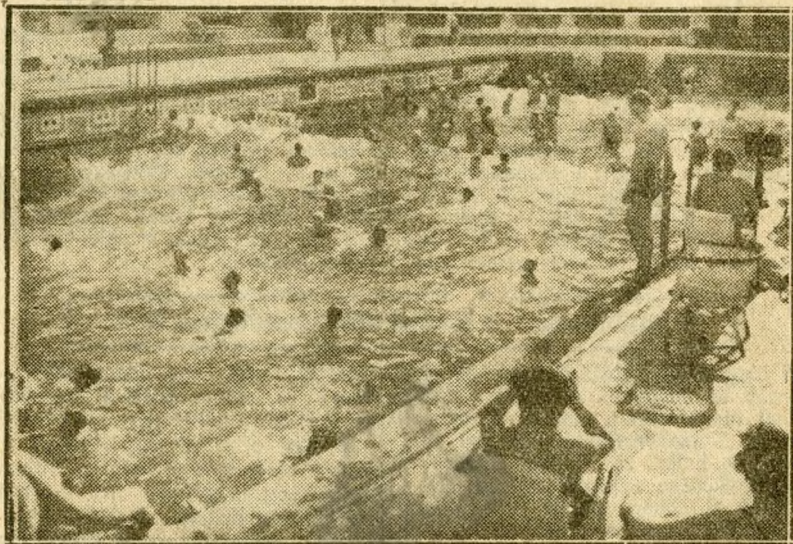
Vidám élet a Gellért-fürdő hullámaiban

Fröcsök vagyunk Este eszik komolyabb ételt, vacsorára. Gyárba ebédel. Sportolni kell. Majd Tili józsef ma vasaskenyeret vitt a Bizony, ez elég sok káldás, azért ment az előző medves lakásokban.) nagy nem volt ennyire, vagy tonké-