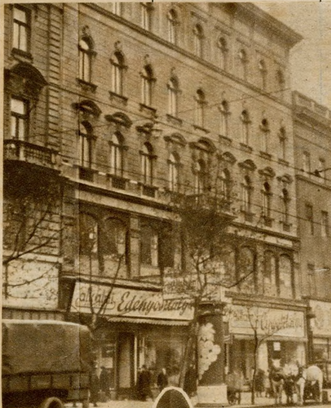
Rákóczi út 22. Ennek a ház- nak a IV. emeletén volt az első állandó stúdió, a III. emeletén pedig a Telefon- hírmondó