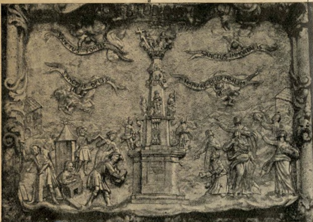
Részlet a budavári Szentháromság szoborból: