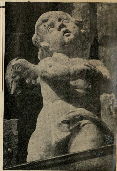
Imádkozó angyal a Szentháromság szobron