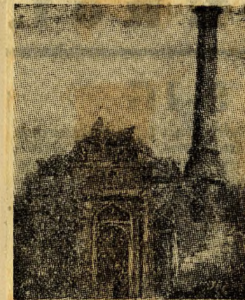
Az utolsó budai mecset