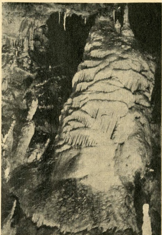
Stalagtit-oszlop az aggteleki cseppkőbarlangban