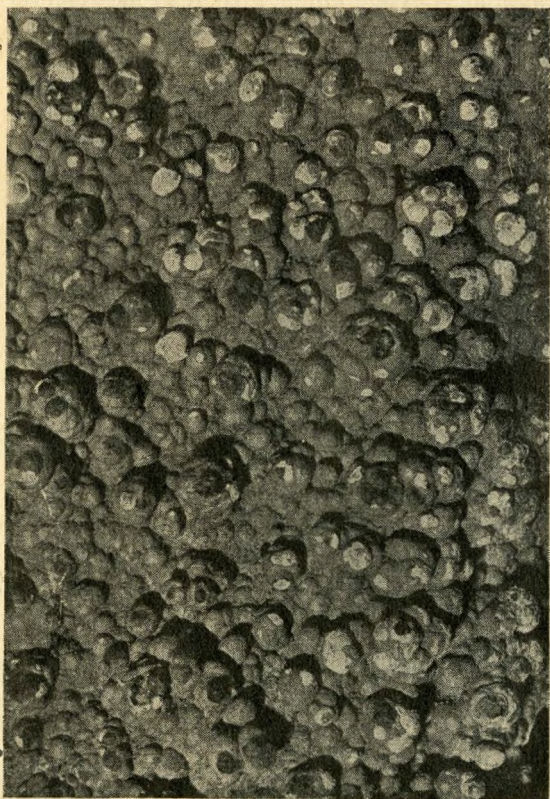
Aragonit a ferenchegyi barlangból

folyosó. Ebbe egy alig huszonöt centiméternyi nyíláson át lehet csak bejutni. A Hosszúfolyosó átlag két-öt méter széles, helyenként tíz-tizenöt méter magas és a hossza körülbelül százhusz méter.