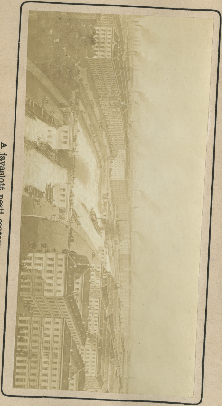
A javasolt pesti gátorna a mentében építendő városrész eszmény-képével.