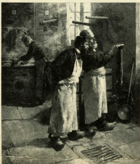
Kelmefestők (XIX. sz.)