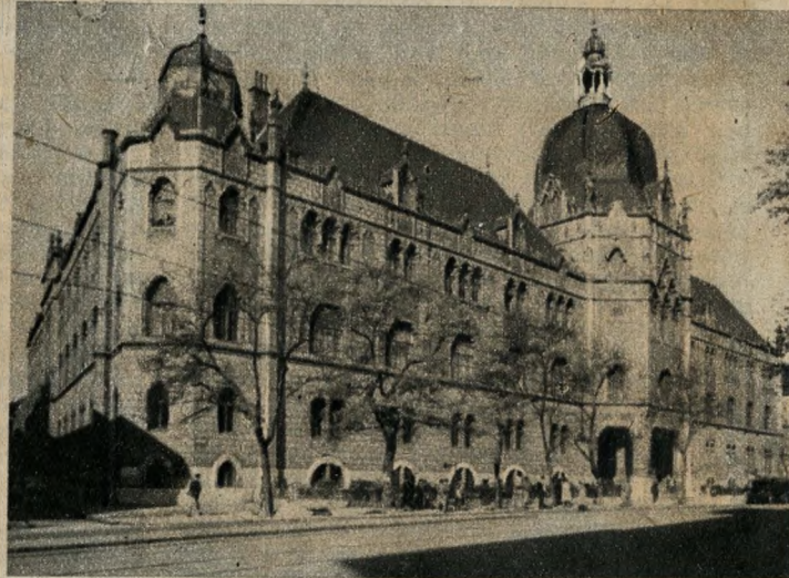
Lechner Ödön alkotása: az Iparművészeti Múzeum épülete