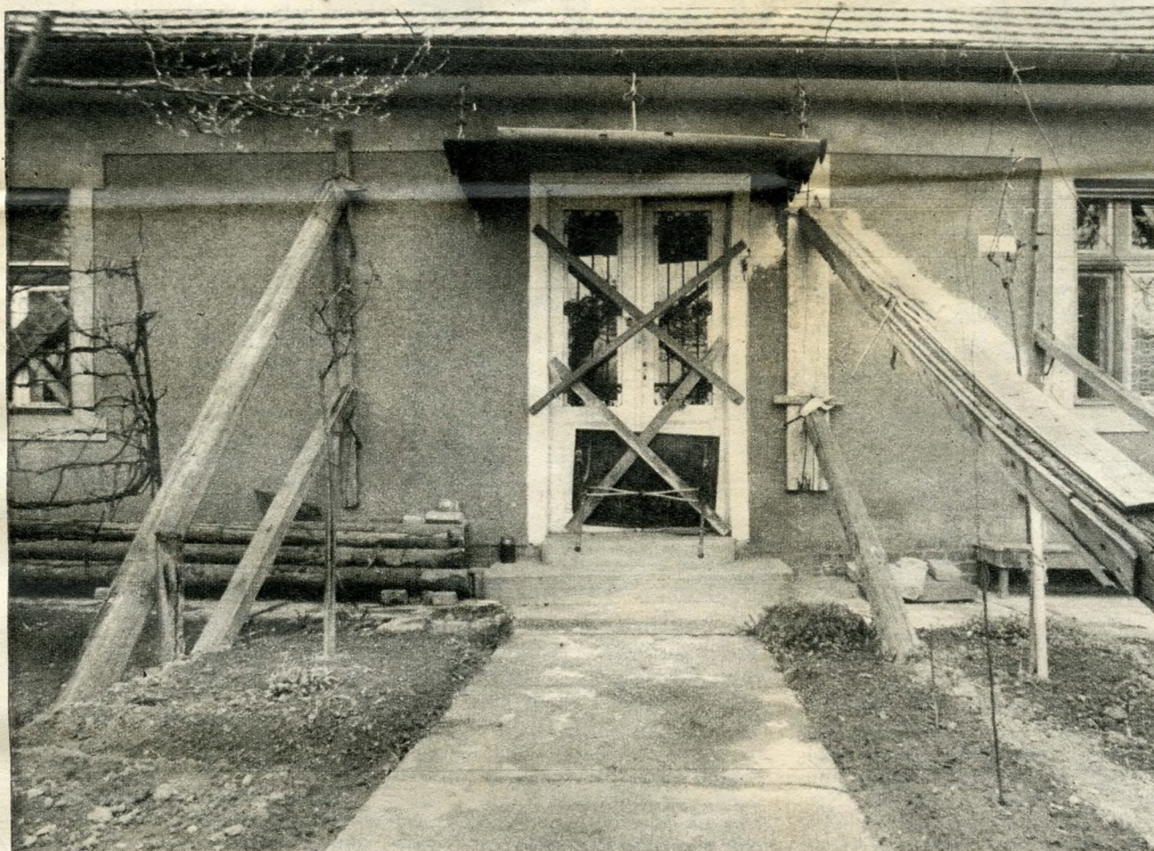
Egy ház, melyet már csak néhány gerenda és az irgalom tart össze

rosrendezési és építészeti főosztálya közli: az Építésügyi Minisztérium foglalkozik már a téglagyári tavak betömésének ügyével.