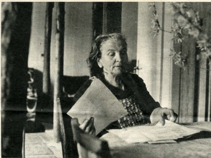
Egy ügyfél tallózása az átiratok és válaszok sokaságában

„... A ... talajmechanikai szakértői vélemény egyértelműen rögzíti, hogy a víztelenítés hatására, szakszerű kivitelezés mellett is károsodás érheti a környező épületeket... Nem vállalhatjuk magunkra a leggondosabb munkavégzés mellett is bekövetkező épületrongálódások miatt várható lakossági perek tömegét és ezek teljes vagy részarányos kártérítését. A kivitelezés egyetlen biztonságos módjára — előrevert szádfalazás védelme alatti építésre — vállalkozni nem tudunk, mert az ehhez szükséges szádpallóval és verőbe-