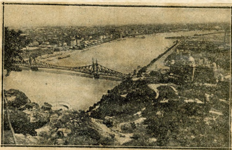
Budapeszt. Most cesarzowej Elżbiety

Do przyjaznej Polski, która nie potrafi dotychczas swej szarej i kochanej Wisielki uczynić węgą herbową, przenikną przecież wzruszająca i popularna piosenka, która obija się jeszcze niejednokrotnie po podwórkach warszawskich znaną melodią: „Nad modrym biegiem Dunaju siedząc, czarna cyganka śpiewała...“ Niezawodnie było to w Budapeszcie.