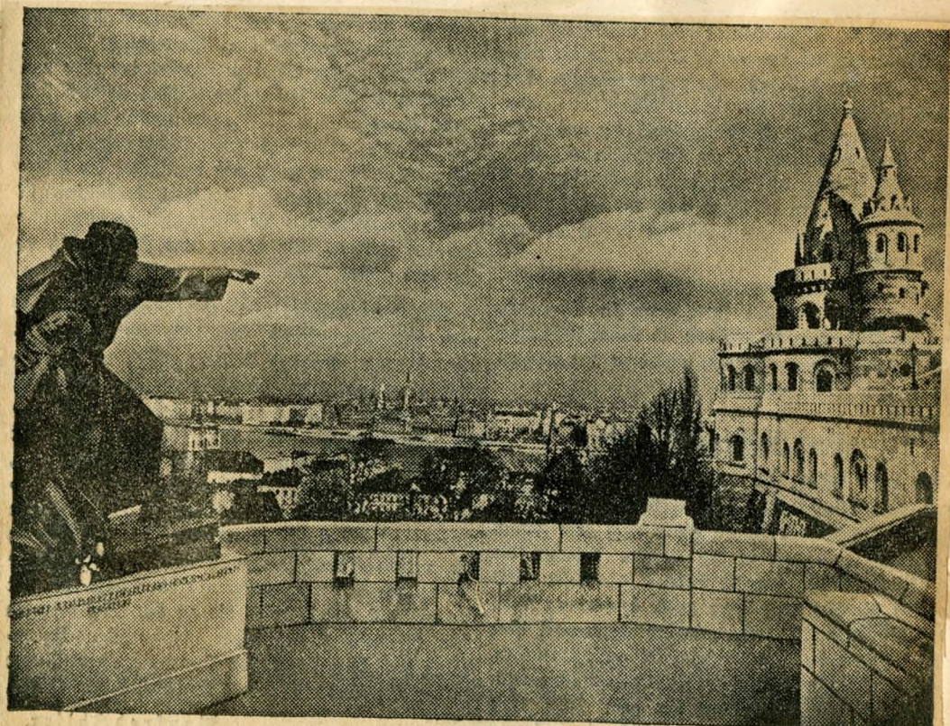
Blick von der Bastei auf die Stadt