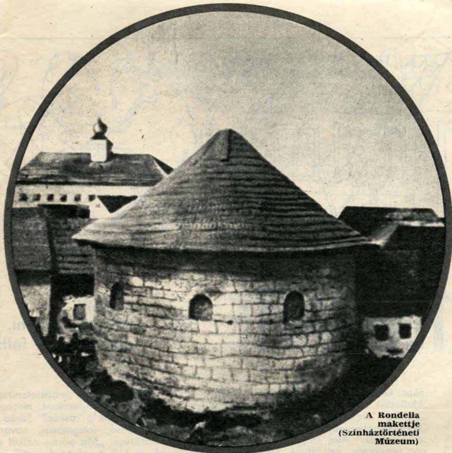
A Rondella maktetje (Színháztörténeti Múzeum)