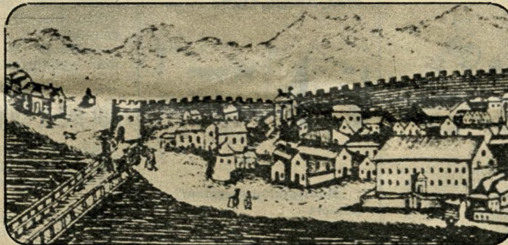
Pest a 18. század végén. A hídtól jobbra a Rondella, kúp alakú tetőzetével