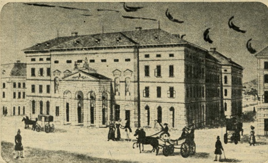
Az 1812-ben épült pesti német színház