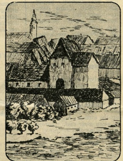
A kép közepén látható magas épület a budai faszínház