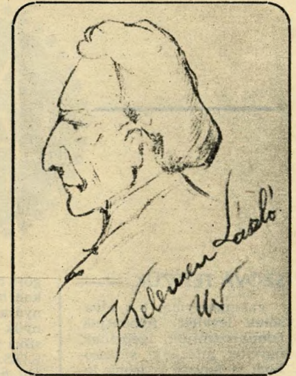
Kelemen László, a hivatásos magyar színészet megindítója