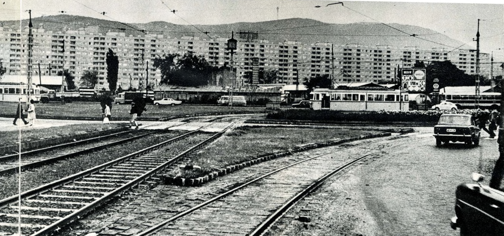
A Flórián tér.

kocsi megjelenésekor szánják rá magukat a költözésre a cserébe kapott távfűtéses, loggias, napsugaras összkomfortba.