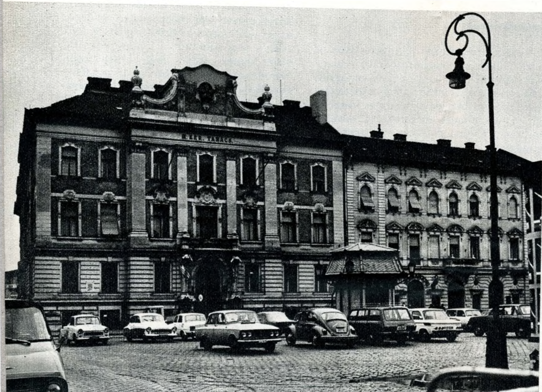
A Fő tér, a Tanácsházával