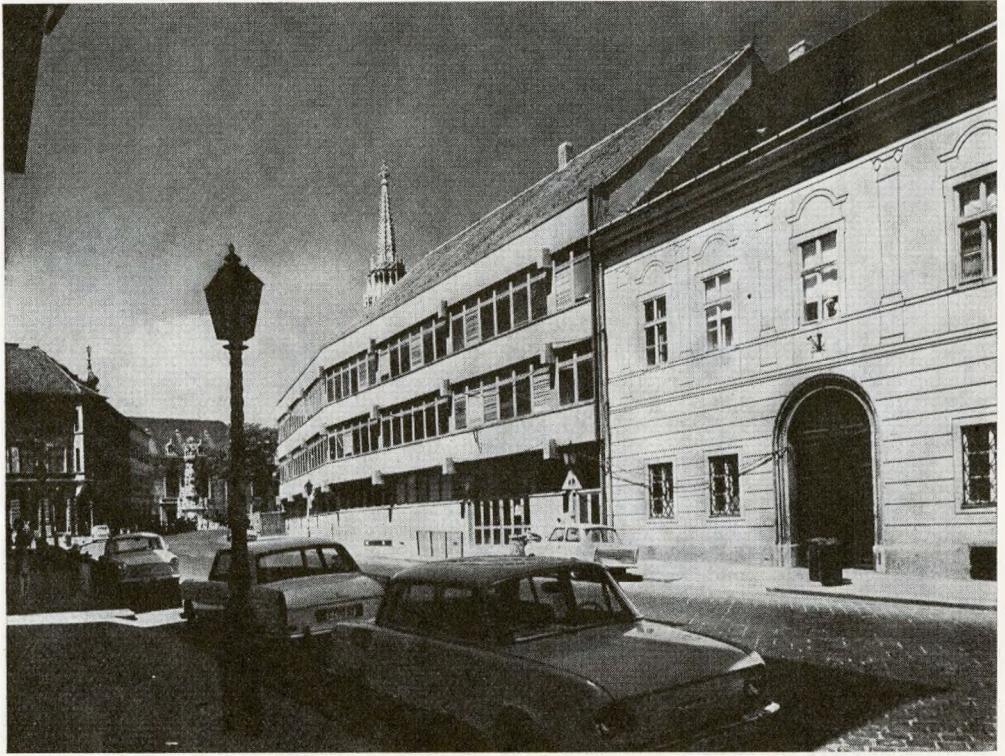
2. Budapest, I. Tárnok utcai általános iskola (Tervező: Kangyal Ferenc, 1969. BUVÁTI)

kapitalista fejlődésének megindulásával (esetleg megelőzi azt). Az ebben az időben elkezdődött iparosodás, a közlekedés fejlődése és a tömeges bérlakásépítés rohamosan megváltoztatta a természetesen fejlődő városok arculatát. Ez a városrekonstrukció azonban a műemlékvárosok esetében elmaradt, ezek – valamilyen földrajzi, gazdasági vagy politikai ok miatt – kiestek az ország eleven vérkeringéséből, s ezért gazdasági pangásnak indultak. Az ilyen város gazdasági életének lanygulása természetszerűleg a bontások és építkezések számának minimálisra csökkenését hozta maga után, s ebben az időszakban itt inkább csak karbantartási, tatarozási munkákat végeztek, nem a múlt öröksége iránti tiszteletből, vagy esztétikai megfontolásból, hanem elsősorban a nagyobb építkezésekhez szükséges anyagi erő hiánya miatt. De mégis ez a nyomorúságos állapot biztosította, hogy a hosszú pangási időszak alatt a régi épületállomány jelentős többsége fenn tudott maradni és az utókor számára idővel műemlékké tudott válni. Az elmondottakból világosan adódik az is, hogy a pangási időszak építészeti stílusá-