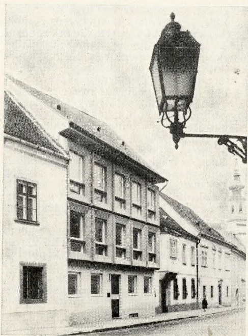
4. Budapest, I. Táncsics Mihály u. 20. (Tervező: Boross Zoltán, 1967. BUVÁTI)

ség által is megtekinthető középületek és templomok enteriőrjeivel, a régi vagy létesülő múzeumok gyűjteményeinek kiállításával.