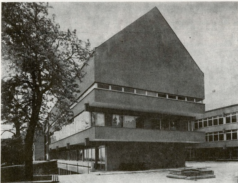
3. Budapest, I. Tárnok utcai általános iskola udvari homlokzata

A műemlékvárosban az idegenforgalom fő vonzerejét természetesen a belső városkép ódon hangulatú, a műemléképületek homlokzatainak együtteséből adódó látványai adják, kiegészülve az érdekes és értékes kapualjak és udvarok betekintési lehetőségével és nem utolsósorban a közön-