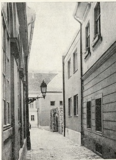
5. Budapest, I. Úri u. 41. Dárda utcai homlokzat (Tervező: Gáspár Tibor, 1967. BUVÁTI)

A régi és az új forma közötti esztétikai törés enyhítése amit tulajdonképpen a mű- emléki környezetbe való „beilleszkedés- nek” nevezünk, gyakorlatban a domináns városképnek való tudatos alárendelődést és ezzel kapcsolatos különféle megkötöttsé- gek betartását jelenti. E megkötöttségek az illető város sajátosságainak megfelelően és az új épületnek a városképben elfoglalt helyét tekintve rendkívül változatosak le-