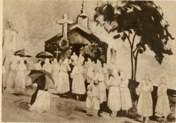
v. Pataky Ferenc: Búcsúsók (Nemzeti Szalon)

Külön jóleső öröm megállapítani azt a rendkívül magas színvonalat, izlést és tudást, amely fiatal iparművészeink munkáiban jelentkezik. A nyugati államokban az ipar minden ágában egyre nagyobb szerepet kapnak az iparművészek, akik a lakás, a ruházatkészítés minden kis részletébe egyéni izlést, művészetet igyekeznek belevinni. Nálunk is hálás és szép feladatok várnak fiatal iparművészeinkre. Ez a kiállítás élő bizonyítéka annak, hogy a jövő feladatait meg is fogják oldani.