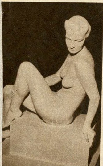
Pédery Dóra: Fürdő