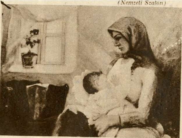
B. Hajgató Ferenc: Az anya (Nemzeti Szalon)