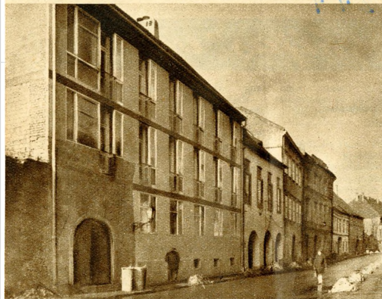
2. kép. Az Úri utca 32. (baloldalt) és 34. sz. épülete