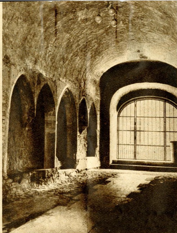
3. kép. Az Úri utca 32. sz. ház kapualja a feltárt középkori üdőtülkékkel