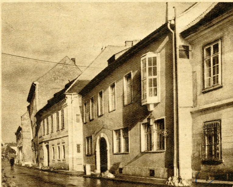
1. kép. Az Úri utca 27. sz. helyreállított épület

A mi Várnegyedünk — ha most nem is szenvedett annyit, mint Varsó — ugyancsak sok vihart látott.