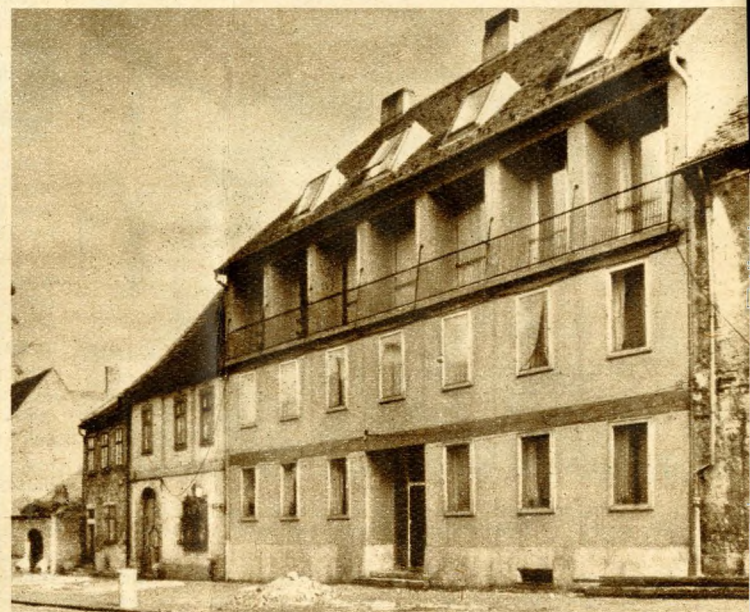
4. kép. Fortuna utca 15. sz. Teljesen új épület alumínium billenőablakkal

Hiba-e hát, ha e viszontagságos történelmi múlt emlékeit újra felépítjük? Hiba-e, ha múltunk tanúit, akár múzeumszerűen is, de megmutatjuk? A XX. század építészetének elég emlékét hagyjuk másutt az utókorra, amely örülni fog, hogy a Várat, mint történelmünk egyik megkövült „zárványát”, számára megőriztük. Hiszen mi magunk is keressük és élvezzük az eltűnt idők hangulatát idéző utcákat itthon és — külföldön. Ne bontsuk meg hát a Vár jellegét, szépségét modern épületekkel. Hiszen korunk építészeti nyelve még maga sem egyértelmű, és ez a városrész nem lehet stíluskísérletek színhelye.”