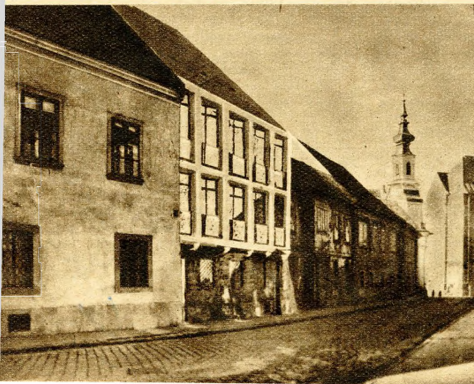
6. kép. A Tánemes utca 24. sz. telek helyére berajzolt modern épületterv

A Fortuna utca 15. sz. 2 emeletes épület (1. 4. képet) ismét Farkasdy Zoltán alkotása, és