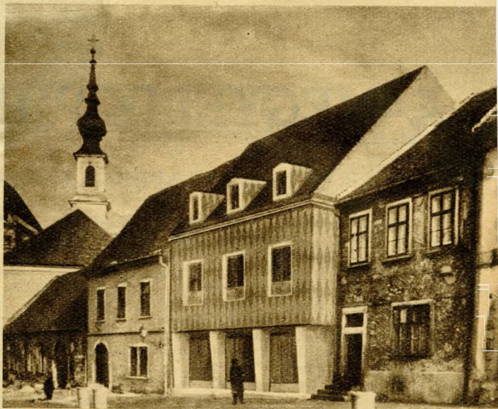
7 kép. A Fortuna utca 21. sz. telekre tervezett sgraffito-homlokzatos épület. A földszinten üzlet