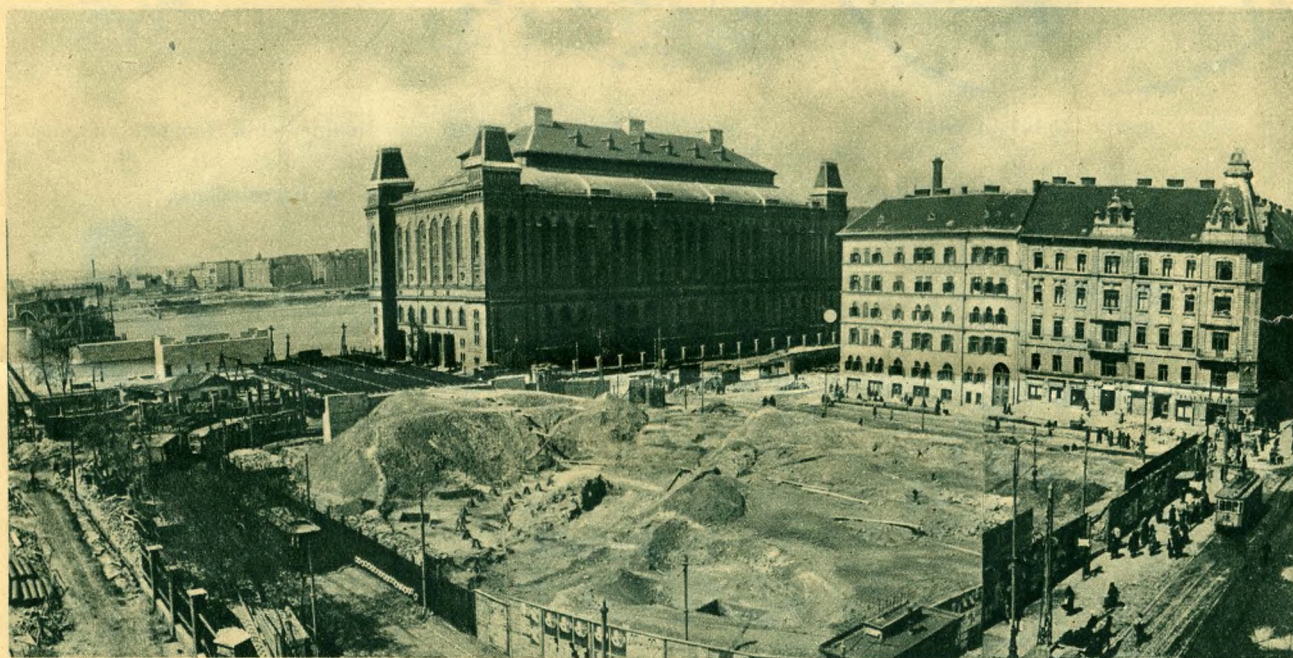
A híd Boráros-terti feljárójának építkezése, középen üreges kiképzéssel, ahol a Beszkárt-hurok talál majd elhelyezést. A középső téren a pontozott vonalon belül fekszenek majd a villamosvágányok.