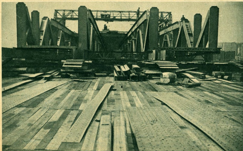
Az épülő vasváz a Duna közepén, előtérben az ideiglenes munkahely.