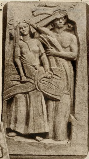
Marosán László : Aratók