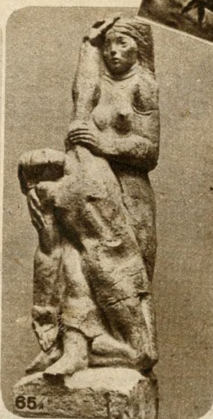
Kerényi Jenő: Pieta