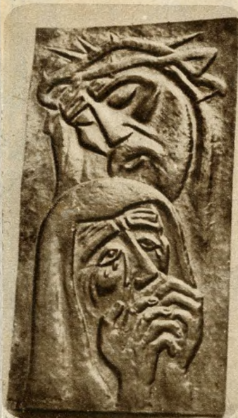
Borsos Miklós: Golgota