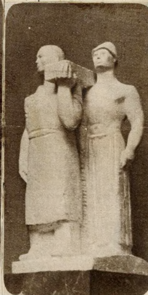
Borbereki K. Zoltán szobra, a „Munka”

kényelme elületességre szoktathatja őket. A fokozott erőfeszítés az eredményeket is minősíti, a körültekintés csak használ- hat a műnek.