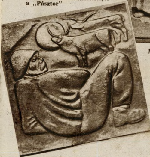
Borsos Miklós bronzreliefje, a „Pásztor”

A történelmi korok művészete fejlett összhangról tanus- kodik az egyes műfajok között, a régi századok folyamán mindenütt hatásos együttműködés figyelhető meg az építészek, szobrászok és festők között. S ez az együtt- működés úgy történt, hogy a mesterek egyike sem ál- dozta föl önállóságát a másik javára, tehetségét és egyé- niségét maradéktalanul kifejtve illeszkedett bele egy magasabb egységbe. A közös munka nem föltétlenül megalkuvás; az alkalmazkodás erkölcsi kötelesség, de nem gát az alkotásnál. Egyik elhúnyt kitünő műtörténé- szünk szerint a művészek a kötött feladatok alkalmával bizonyíthatják be legmutatósbabban a képességeiket. A meghatározott feltételek találékonyságukat erősen próbara teszik, viszont a határtalan művészi szabadság