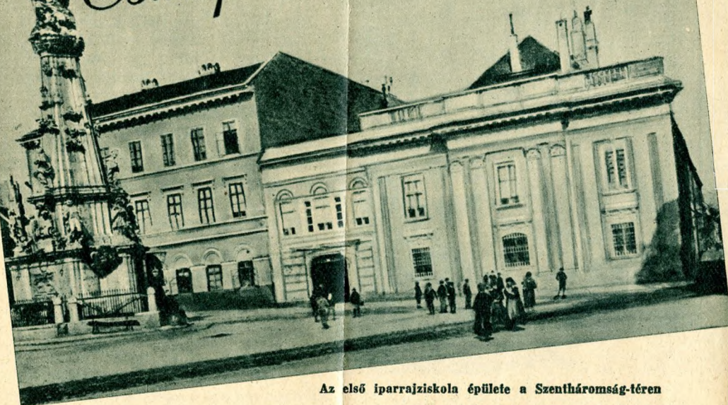
Az első iparrajziskola épülete a Szentháromság-téren