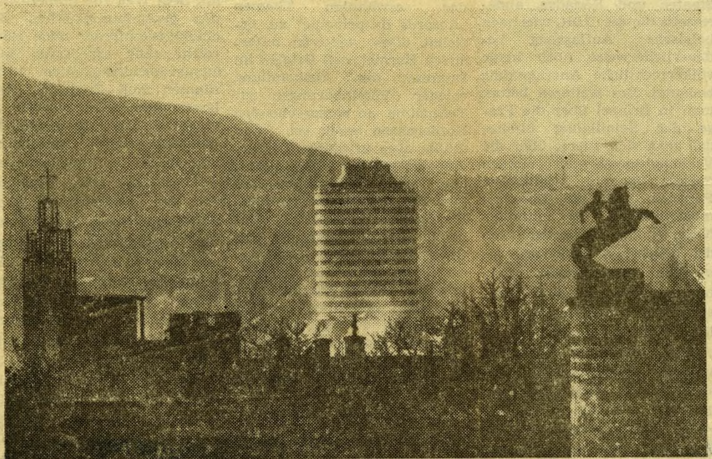
Blick vom Festungsberg auf die Budaer Berge und das Turmhotel Budapest