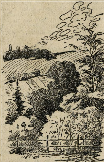
A zugligeti üdülőttelep kertéssel elzárt környéke

dős hegyoldalt zár el a nagyközönség elől.