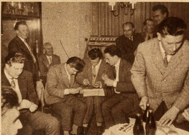
Egy este a csepeli klubban. Labdarúgók, atléták, kajakosok „vetelkedője”

fémjelzi sikereiket. S azóta 145 csepeli sportoló húzhatta magára a válogatottságot jelentő címeres mezt. Huszonegyen világ-, Európa- és olimpiai bajnoki címmel is dicsekedhetnek.