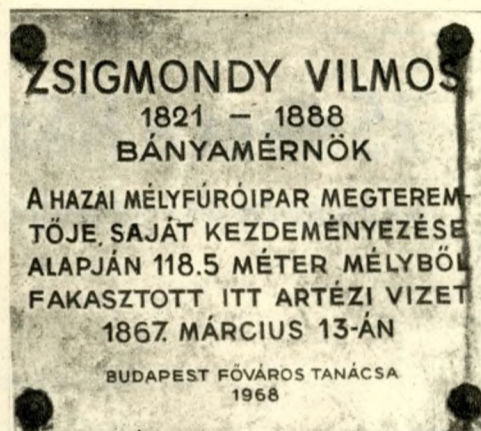
Emléktábla az 1. sz. artézi kútnál