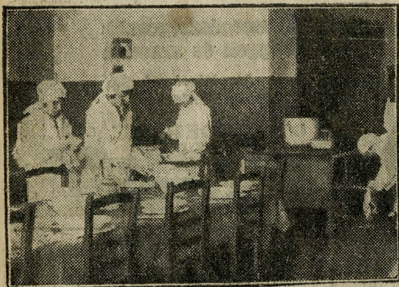
Iskoláslányok háztartást tanulnak.

a rászorultaknak. Az épületben több közös hálóteremmel rendelkezik. Kétszáznegyven ágy talál gazdát minden este. Az éjszakai szállás 24