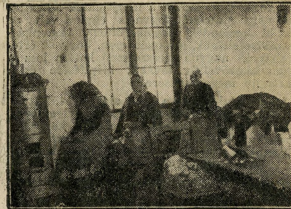
A nők melegedő szobájában.

sak lakóhelye. Itt laknak azok a munkásesetládok, amelyeknek gyermekei hajtűvel összefogott, rongyos talpu cipőkben gázolják a sárat, havat, itt laknak azok a családok, ahol fázva, vágyakozva várják vissza az anyát, aki néhány kanálnyi meleg ételt hoz haza a népkonyhából. És innen rekrutálódnak a napközi melegedőszobák és éjjeli menhelyek szánandó