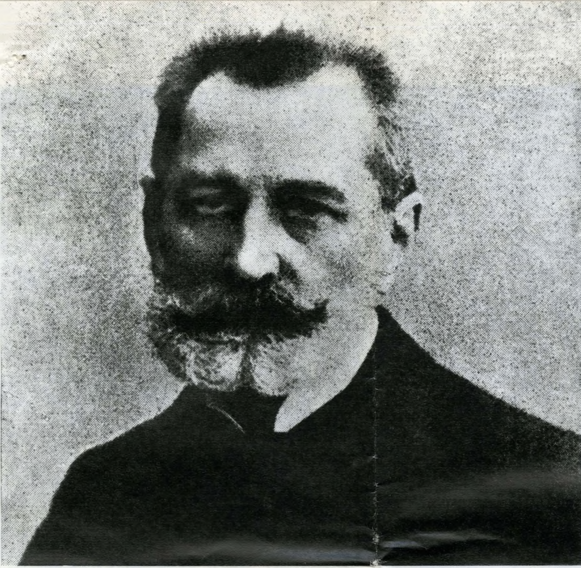
Siklós Péter reprodukciói