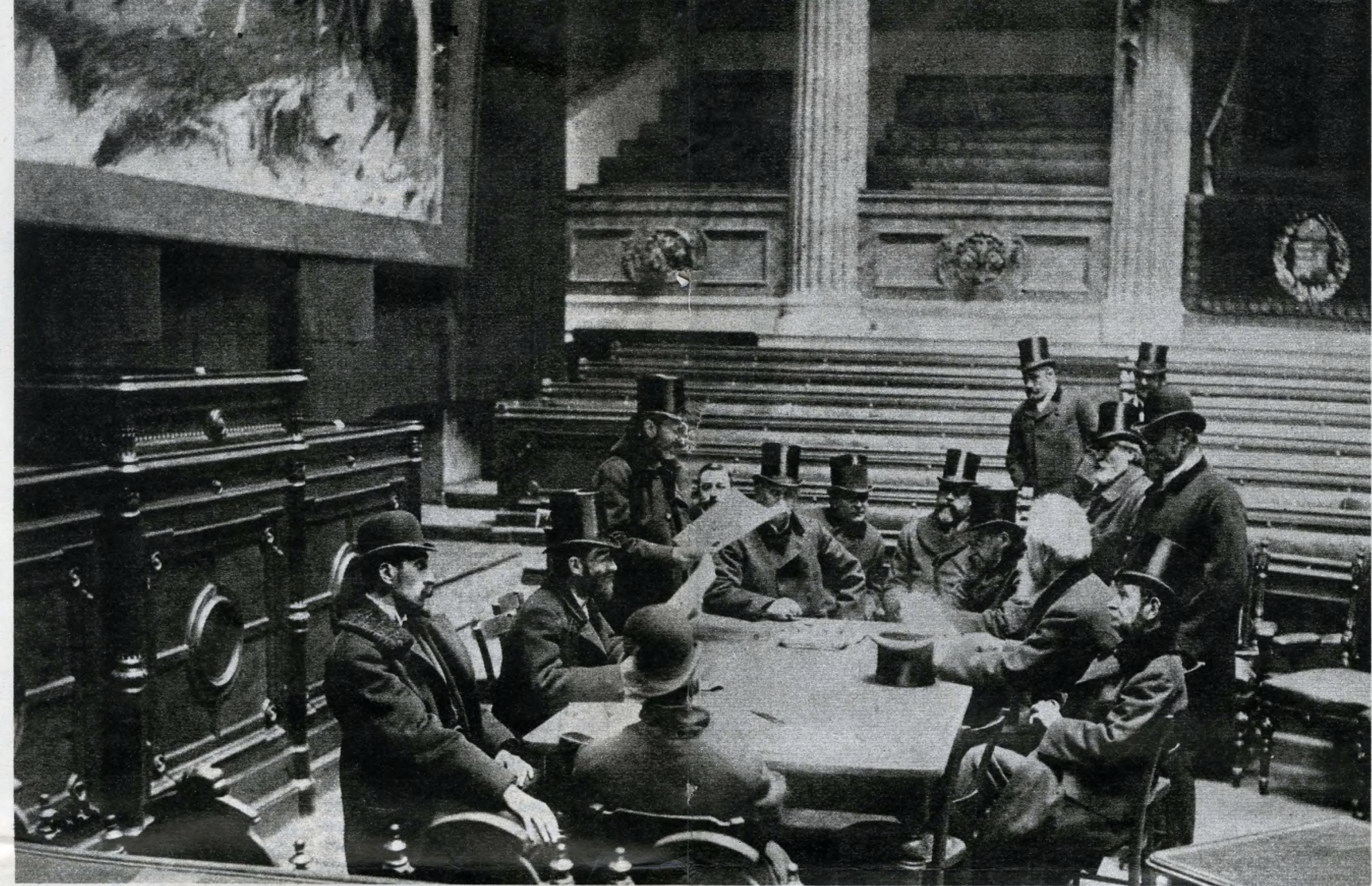
Munkácsy Mihály „Honfoglalás” c. képének átvétele 1894-ben. Jobbra, fedetlen, ősz fejjel Munkácsy, balra, az olvasó alak Ney Béla