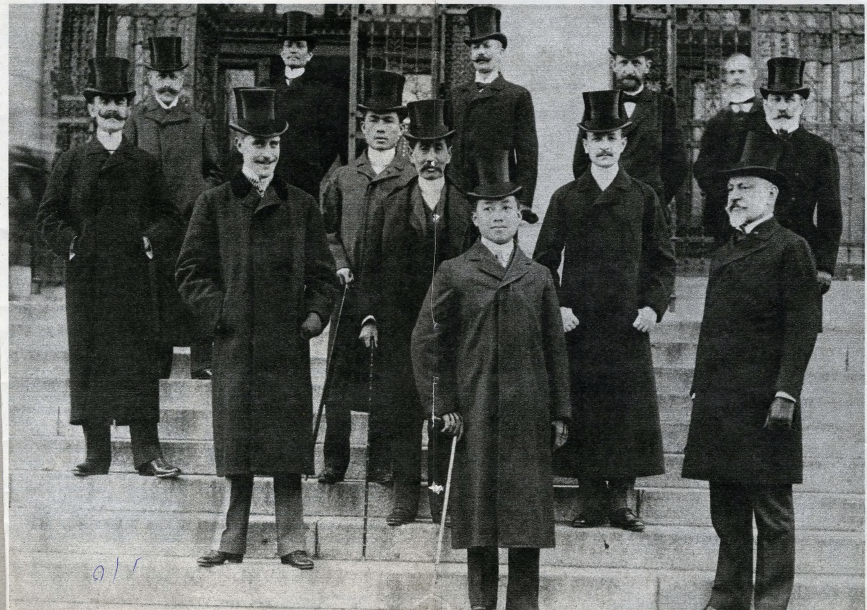
A sziámi király látogatása az új Országházban (1900). Elöl, középén a király, a felső sor jobb szélén Ney Béla