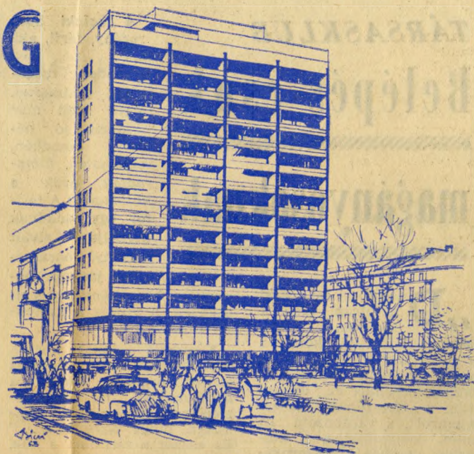
A tűzfalat takaró ház a Horváth-kertnél.