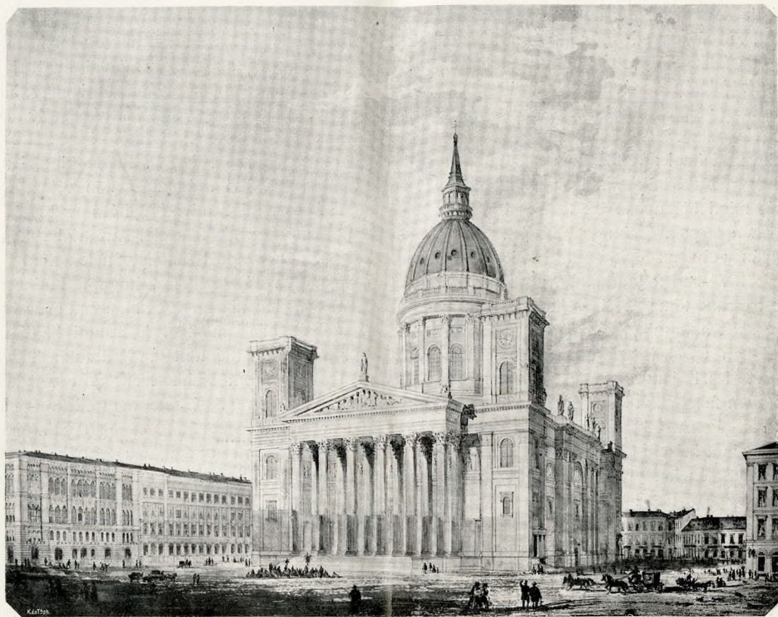
A SZENT ISTVÁN TEMPLOM TERVE YBL MIKLÓSTÓL

kező évben már a terv megvalósítására kezdtek gondolni. Akkori művészeti viszonyainknak ma már szinte érthetetlen szegényességére vall, hogy a városi tanács 1822-ben Schwartz József rajztanítót is főlészólitotta a templom tervének elkészítésére. Schwartz a tanácshoz intézett beadványában mentegetődzik is: „mint-hogy nem vagyok gyakorló építőmester, hanem csak elemi rajztanító, távolról sem hiszem, hogy tökéletes, vagy egészen kielégítő munkát készíthetek“. Schwartz két alternatív terve nem is jöhet számba mint komoly építészeti mű; inkább a kor építészeti képzeletéről, mint tudásáról tanuskodik. Az üres, antikoskodó formákkal egyes rokokó elemek naiv, nyers módon egyesülnek. Nem sokkal jobb a többi terv sem: egy névtelen, B. betűvel jelzett terv, óriási, szinte fantasztikus kupolával és oszlopokkal, valamint Kasselik Ferenc, a régi városház későbbi építőjének terve, szintén sivár, szellemtelen klasszicizmus alkotása.