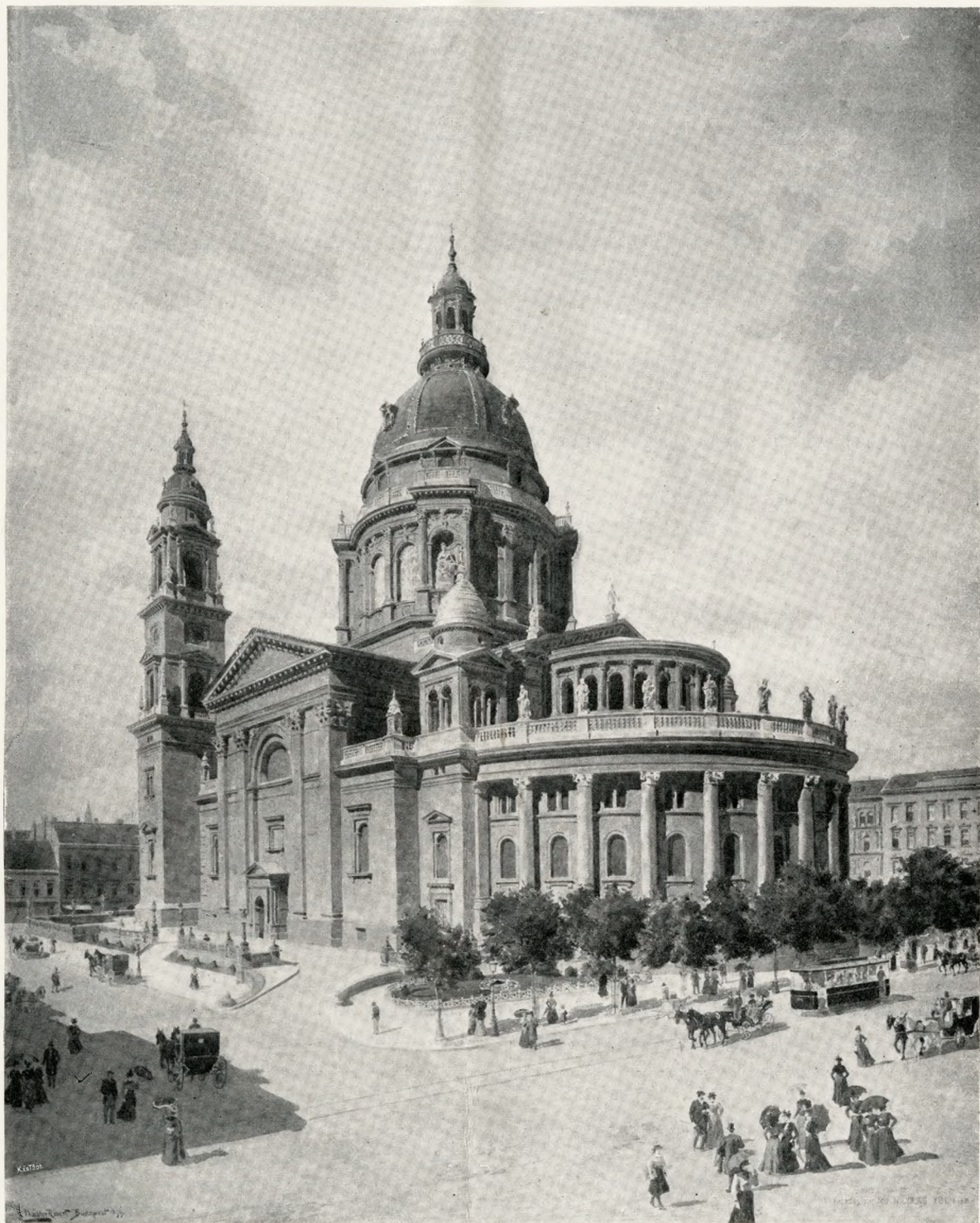
A SZENT ISTVÁN TEMPLOM DÉLKELETRŐL TEKINTVE NÁDLER RÓBERT VÍZFESTMÉNYE A SZÉKESFŐVÁROSI MÚZEUMBAN