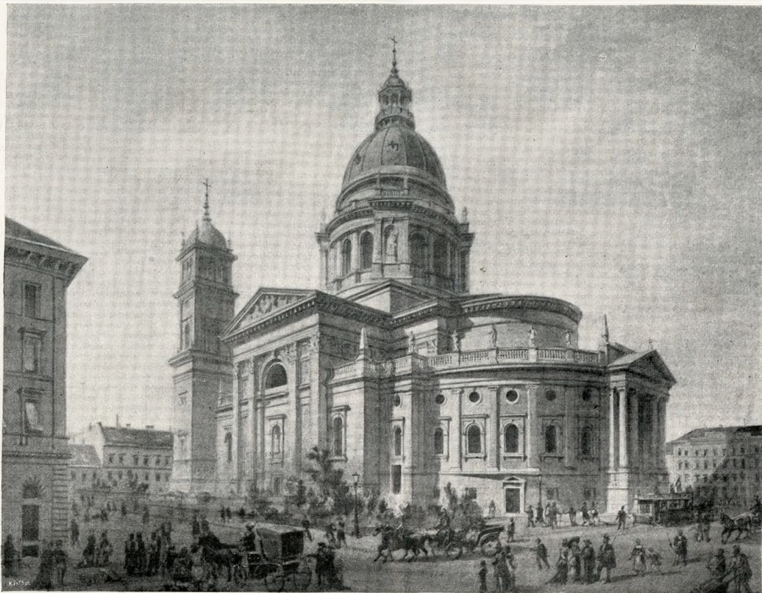
A SZENT ISTVÁN TEMPLOM YBL-FÉLE TERVE VÍZFESTMÉNY A SZÉKESFŐVÁROSI MÚZEUMBAN

mindvégig kíséri —, de kénytelen azokhoz az új feladatokhoz alkalmazkodni, amelyeket az idők folyása elébe tárt. Végül pedig az egyedüli menedék, amelyben még bízni lehetett.