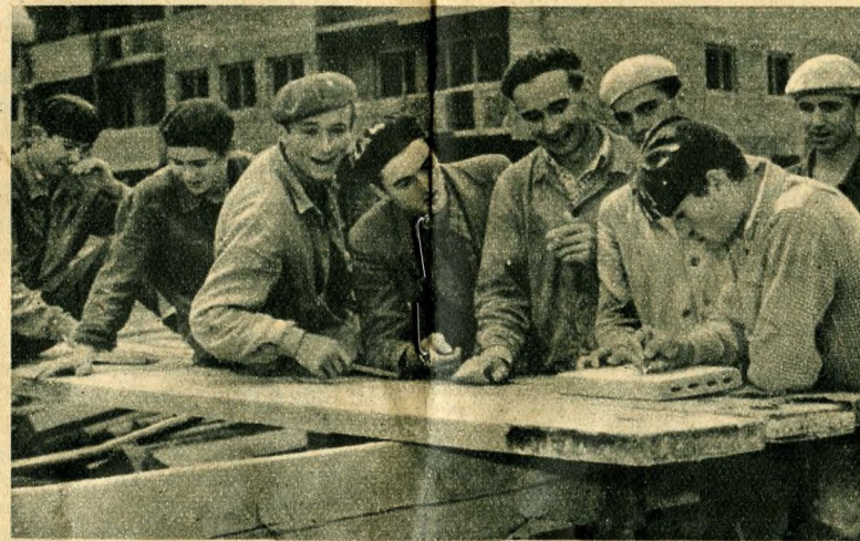
A Kutrovcics-brigád kiváló eredményeinek titka a meggondolt, tervszerű együttműködés

pali szobát és több különálló kisebb szobát építsenek, így lehetőség nyílik a vendégfogadás, a pihenés, a tanulás és több más otthoni tennivaló egyidejű lebonyolítására. A lakásokhoz három féle konyhát építenek. A kis garzonlakásokhoz főzőfülkét, a nagyobbakhoz főzőkonyhát, vagy étkezőteret konyhát. Az étkezőtér nagy előnye, hogy toboajtóval, függönnyel, vagy bármely más megoldással a konyhához, vagy a szobához csatolható, vagy azoktól teljesen elválasztható.