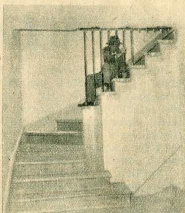
A kétszintű lakás falépcsős feljárata a hálólhelyiségekhez

E terv végrehajtásának kicsiny, de jelentős kezdete ez a kísérleti lakótelep. Itt Óbudán, az elkészülő lakótelep új lakásaiiban otthont találó családok véleménye alapján döntenek majd el az illetékesek, hogy a tizenöt