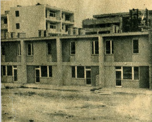
Kétszintes lakások. Minden lakásnak külön kertje, pincéje van; a földszinten a konyha és mellékhelyiségek és a kertre néző nappali szoba, az emeleten a hálószobák és a fürdőszoba