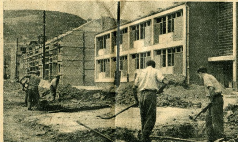
Hamarosan átadásra kerül ez az egyemeletes kertés ház

Nézem a lakásokat, a készeket és a készülöket, nézem a tervrajzokat és egyre erősödik az érzésem: nagyon nagy öröm lesz ezekben a lakásokban lakni. Néhány helyen a műanyag is megjelent már. A lakások padlózata már mindenütt műanyagból készült. A külső homlokzatot néhány háznál magyar gyártmányú műanyag-festékkel festik be. Műanyagból készült csapokat,