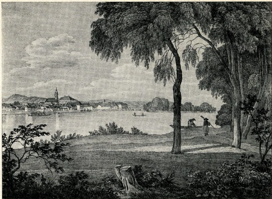
Óbuda a 19-ik században (J. Alt metszete)