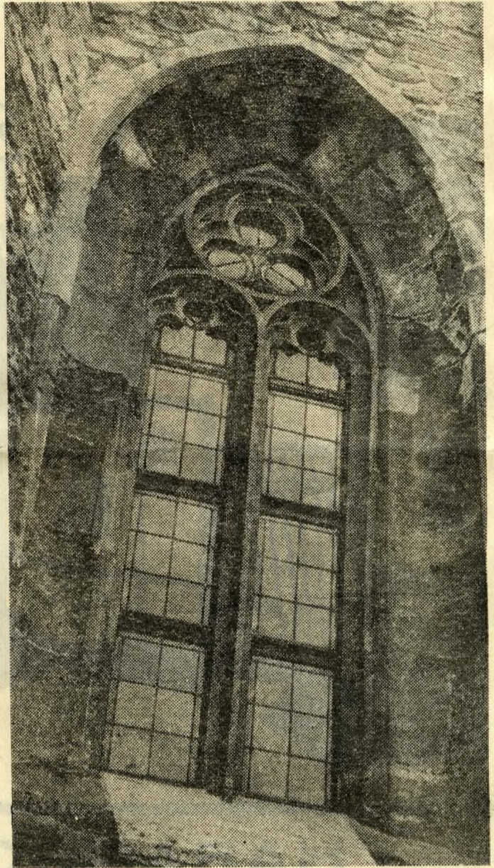
A mai kor embere hozzászólt a monumentális látványokhoz. Am a középkorban is kacérokodott az ember a hatalmas arányokkal. Ime: a budai vár középkori Zsigmond-kápolnájának egyik gótikus ablaka.

Oroszlánfejes vízköpők a Zsigmond-kútról, ugyanebből a korból női szobortörzsek, reneszánsz párkánydisek vörösmárványból, szerráf fejek a kazettás mennyezetben, királyi címerek, használati tárgyak, emlékek — tömegével. És Mátyás király kútja a maga és felesége címerével.