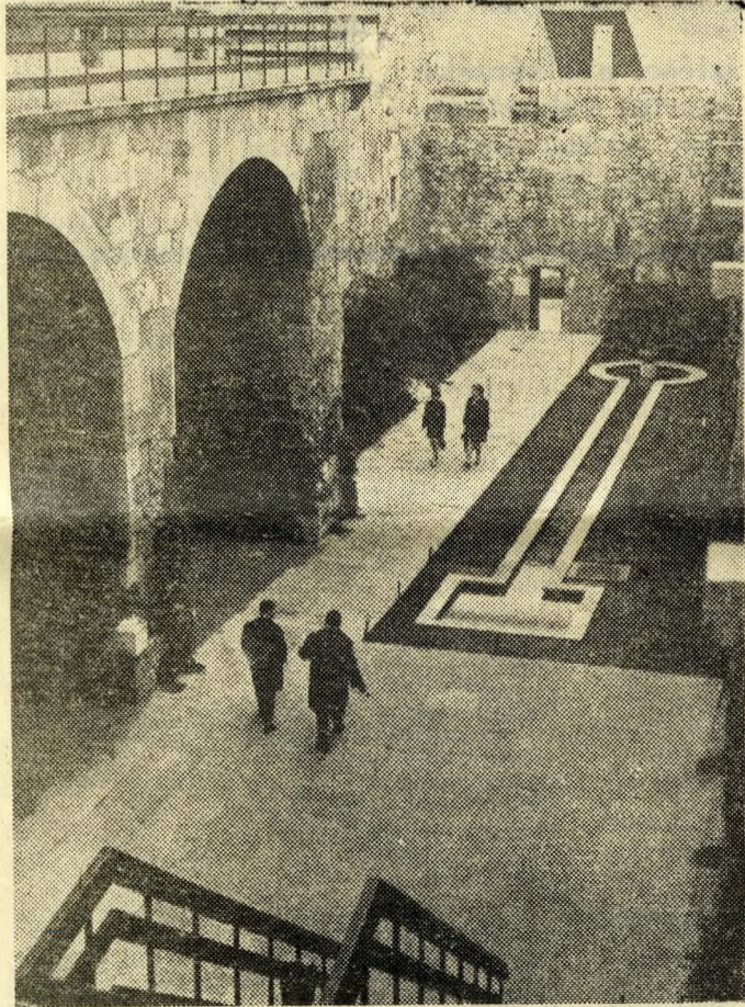
Tíz méter magas törmelék takarta ezt a több száz éves falmaradványt, amelynek „gyilokjáró” a neve. Három méter széles a falkolosszus, amelyen a vigyázók sétáltak. Az alsó — fedett — részen ugyancsak az örök járőrhelye volt.

Emlékezzünk csak a Szép Ilonkára; a királyi udvarba felránduló „ősz Peterdi” mondja szerelmes lányának: „Jobb nekünk a Vértes vadonában...” Félelmetesen idegen volt nekik a zajos udvar,