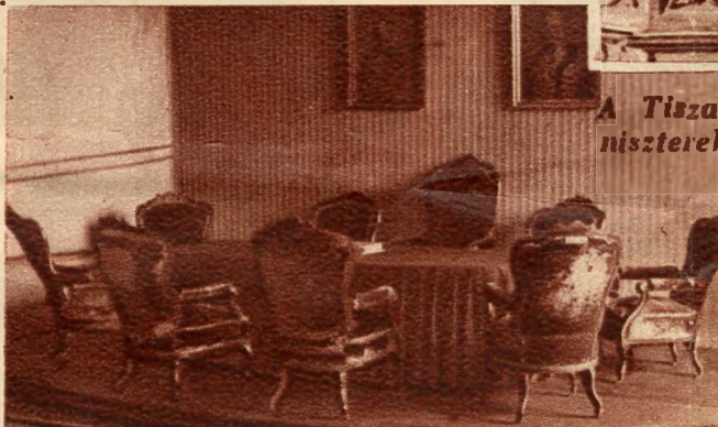
Az első független magyar minisztérium karosszékei.

Nem is kell felülnünk Wells időgépe, belépünk a parlament épületének XVII. kapuján, felmegyünk a félelemre és máris elbucszunk a mai kortól, benne vagyunk 1848-ban. Ez a Parlamenti Múzeum első terme. A szoba egyik felét hatalmas freskó foglalja el: az erdélyi országgyűlés, amely Magyarország és Erdély egyesülését kimondta. Előtte pódiumon kopott, megviselt piros karosszékek: az első független magyar minisztérium karosszékei. Egykor Batthyány gróf és miniszterlátsai ültek bennük. És a szobában köröskörül 1848 emlékei: a Kossuth-bankó kliséje, a független magyar sajtó első termékei, albumok, okmányok, érmek, mind mind erről a dicsőséges korról regélnek.