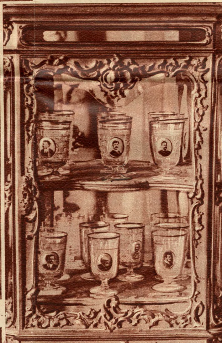
A Tisza Kálmán-kabinet metszett poharai a miniszterek arcképeivel, alsó sorban a középső Tisza Kálmáné.