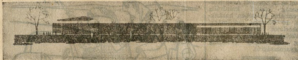
Az épülő trolitároló telep javítócsarnokának Salgótarjáni úti homlokzata

zö kocsik áthaladnak az automatikus mosóberendezésen, innen kerülnek a szervizbe, ahol a legaprólékosabban megvizs-