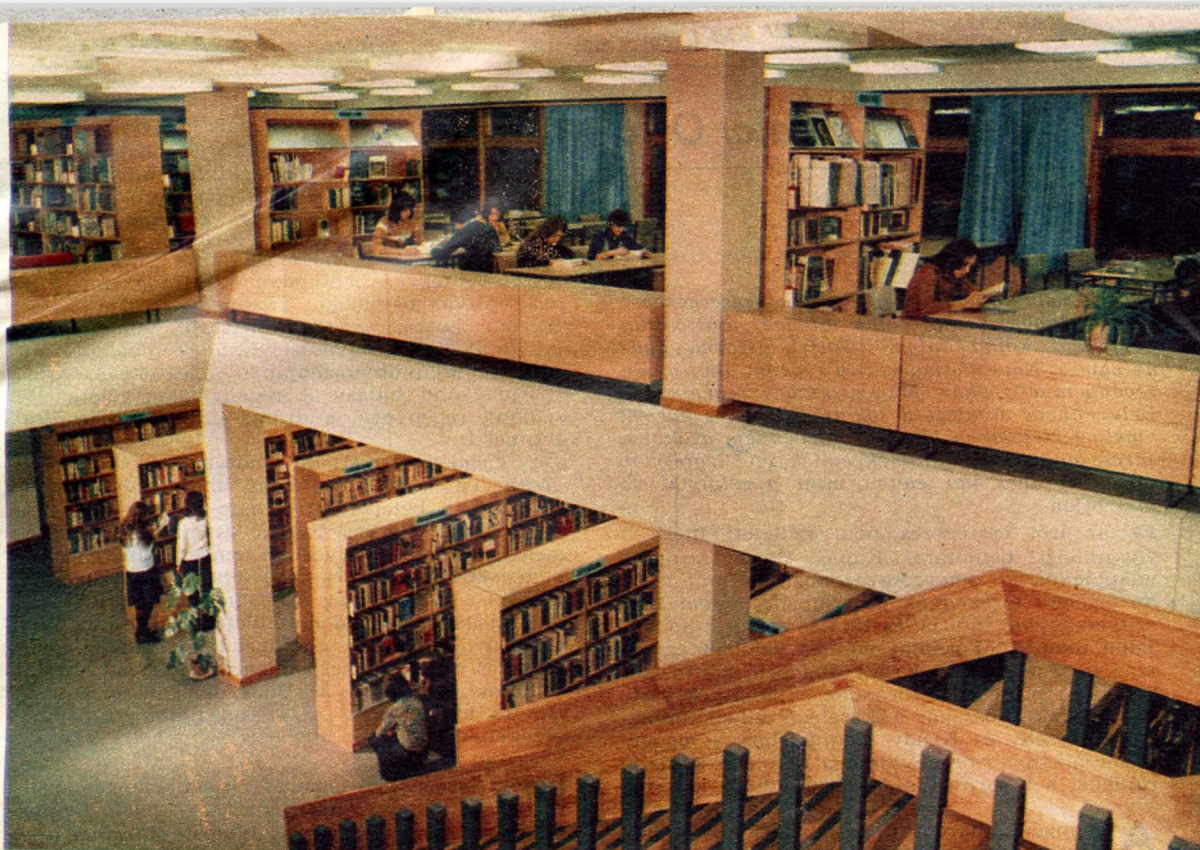
80 000 kötet közül válogathatnak a Szabó Ervin Könyvtár új részlegében