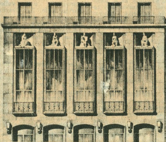
A tervezett Fővárosi Vigszínház homlokzata