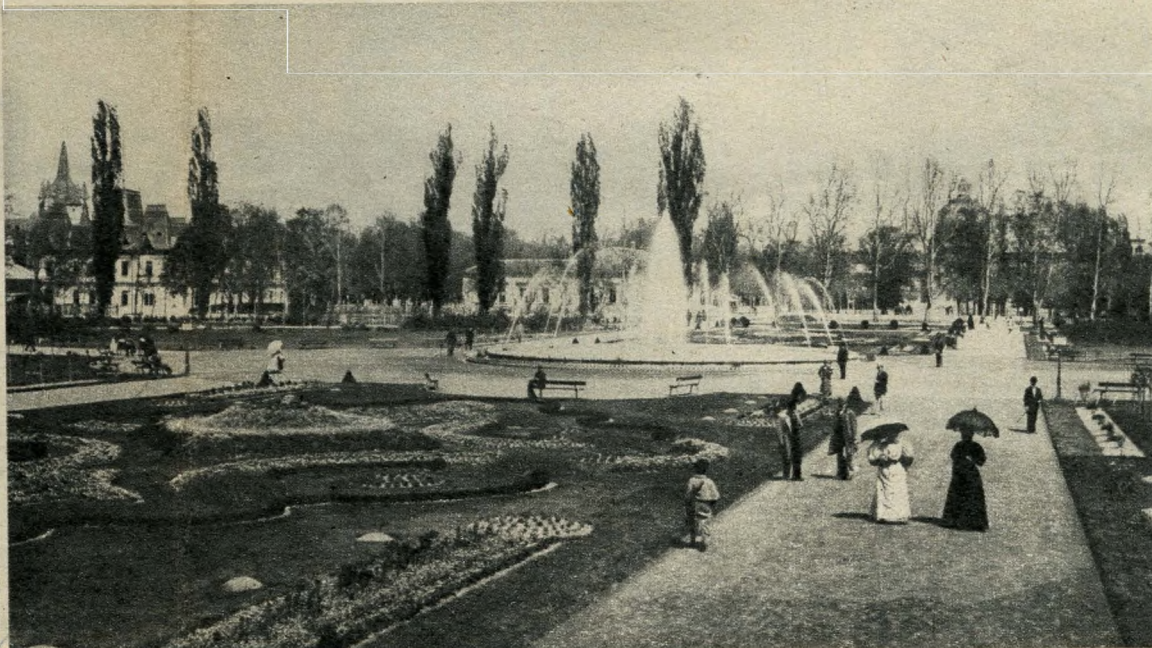
A Városliget a századforduló éveiben

A Vásár épületeinek a zömét már lebontották. Továbbra is a helyén marad a Petőfi Csarnok, valamint a Nehézipari Minisztérium kupolás épülete. Mindkettő sportcsarnokul szolgál a jövőben.