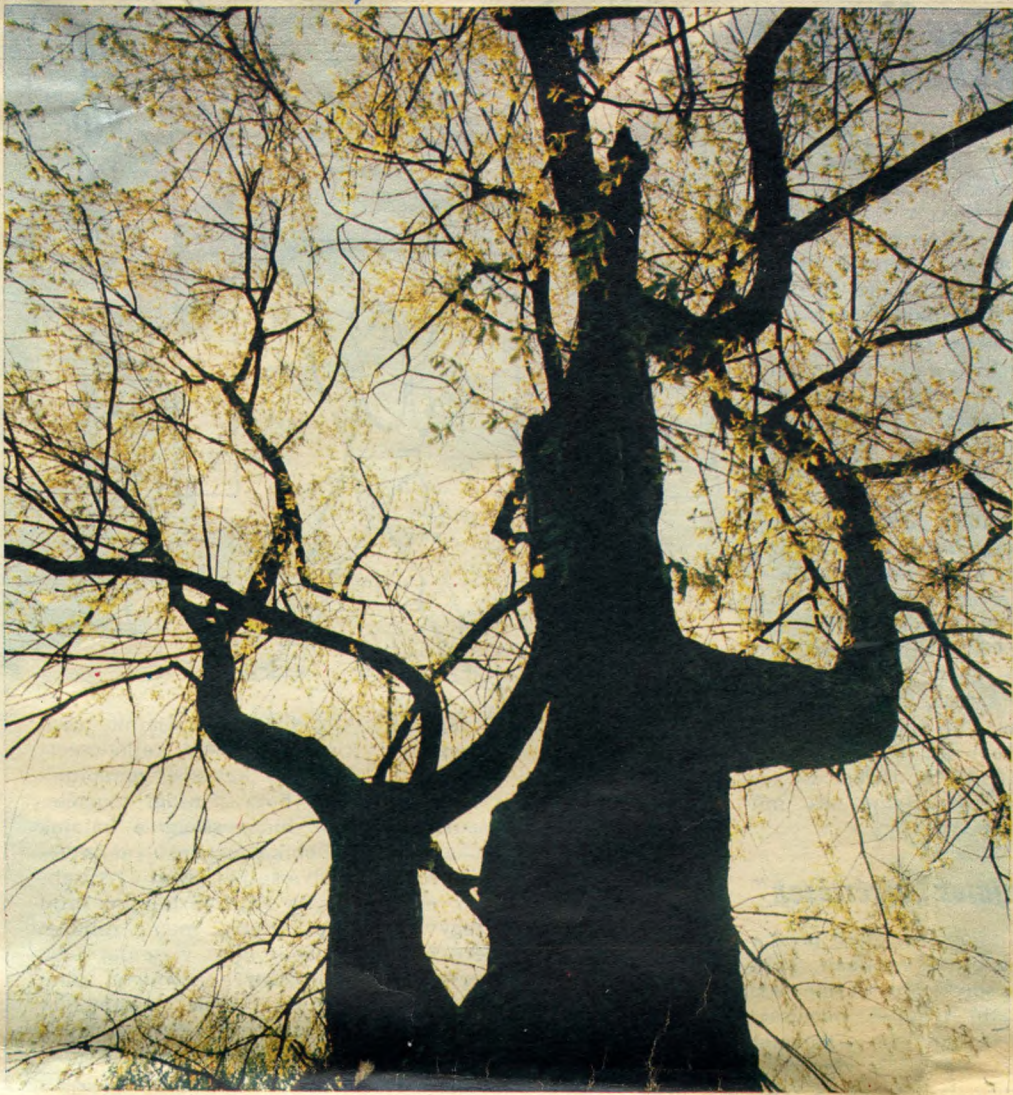
Ez a mocsári tölgy még ma is őrzi az egykori Őkördülő emlékét