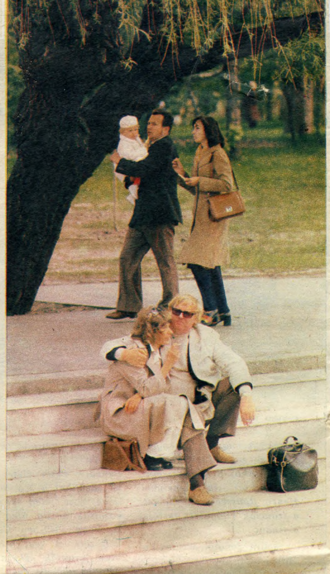
A tóparti lépcső — a mennybe vezet