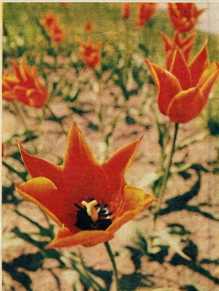
A Fővárosi Kertészet tizenháromezer Hollandiából importált tulipánmagját ültetett ki. Ma letarolt ágyak vádolják a virágtolvajokat

A kis földalatti egykori végállomásának már nyoma sincs. A helyére épített „labirintusban” apró gyermekek bújkálnak. Ezt a környéket nem hódította el a