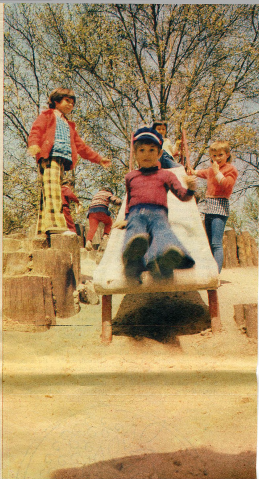
Az egyetlen hely, ahol lecsúszni öröm — a csúszda