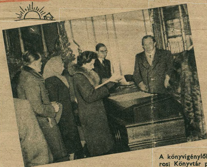
A könyvigénylők hosszú sora várakozik a Fővárosi Könyvtár pultja előtt