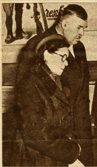
Megelevenedik a múlt... Mintha magát látná Holler bácsi a börtönudvaron sétáló foglyokban.