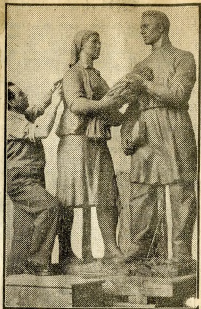
Ez a szobor a Népstadion-állomást díszíti majd.

április 30-ra készül el. A „Szocialista tudomány”, Tarr István műve, büszke testtartású parasztleány, búzakévével, mellette laboratóriumi köpenyes fiú. A további két szoborpár a szocialista munka és a szocialista művészet jelképe lesz.