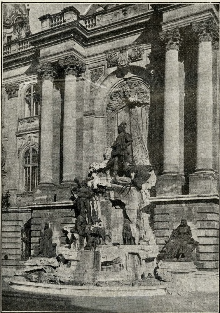
La Fontana di Re Mattia nel Palazzo Reale

prime preoccupazioni degli stranieri che giungono a Budapest sia quella di osservare, lungo la aristocraticissima passeggiata del Lungo Danubio, le gambe che sono esposte con noncuranza sulle file di panchine. Si dice e io mi ricordo d'averlo letto. Ma debbo subito avvertire che alludo alle gambe delle donne (prima che me le dimentichi) che quelle degli uomini non contano. Per conto mio, credo bene aggiungere quest'osser-