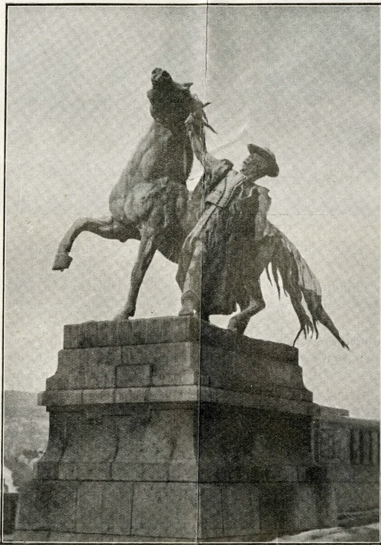
Monumento allo « Csikòs »

Perchè le donne ungheresi sono tanto belle? Sarebbe lo stesso che domandare perchè la terra gira. Eppure c'è chi s'è provato a dare una risposta. E magari con convinzione! Dice: il miscuglio di razze ha prodotto l'esemplare perfetto. C'è qualcosa del primitivo sangue indigeno, un po' di sangue tartaro, un rimasuglio delle invasioni romane e il frequente contatto con i Turchi... Sarà. Ma, e gli uomini, allora? Capaci di risponderti: Gli uomini non fanno testo. Sono le donne quelle che contano. E che hanno saputo prendere il meglio da dove l'hanno trovato. Io non cerco ragioni: osservo che realmente l'Ungheria è la terra classica delle donne belle. Trovi in loro la birichineria delle Americane, la perfezione delle Inglesi, l'ardore delle Italiane. E di più ancora in un esemplare unico.