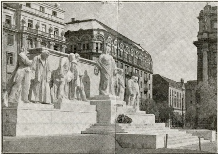
Monumento a Luigi Kossuth

di Santo Stefano. C'è tuttavia il simbolo della più illustre regalità, custodito nel palazzo di Mattia Corvino: la Corona di Papa Silvestro per il Primo Re. Croce piegata dagli eventi, croce