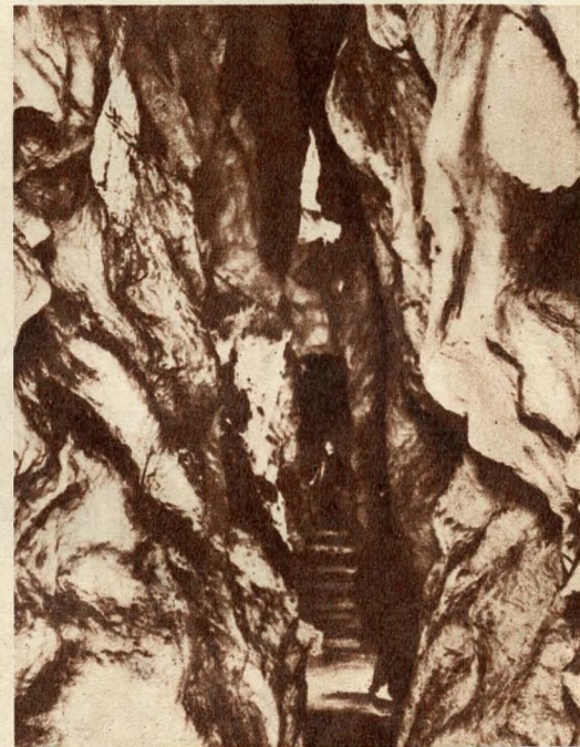
Részlet a Pálvölgyi cseppkőbarlangból