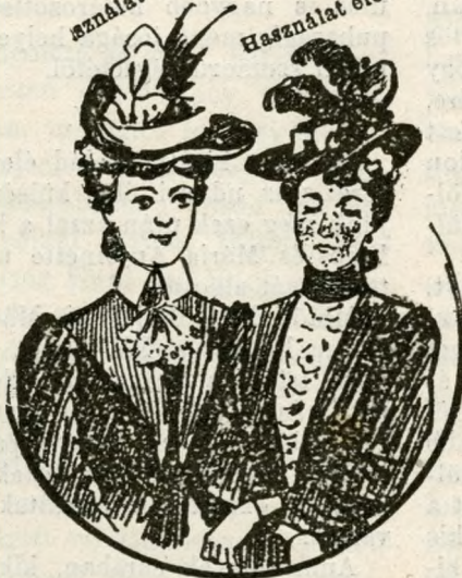
A Diana-crém s Diana-szappan 4 napi használat után.