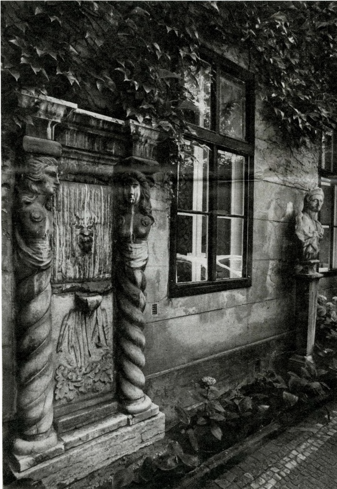
Kút a Magyar Építőművészek Szövetsége székházának udvarán. Dienes Lajos utca 4.

Pest város tanácsa 1871-ben foglalkozott Esterházy Pál gróf építési engedélyével, hogy a „József-külvárosban az Ötpacsirta utcában a testgyakorló iskola helyén — ma Pollack Mihály tér 8. — kétemeletes palotát építhessen?”. Az 1874-re felépült palota a lapok bírálatának pergőtüzébe került. Támadták, hogy hatalmas tömegével megbontja az Ybl tervezte egységes utcaképet. Eklektikus, masszív építmény, oszlopos kapuval, konzolos főpárkánnyal. Sorsa olyan változatos, mit egy kalandos életrajz. Volt az Egységes Párt székháza; tartozott a Nemzeti Múzeumhoz