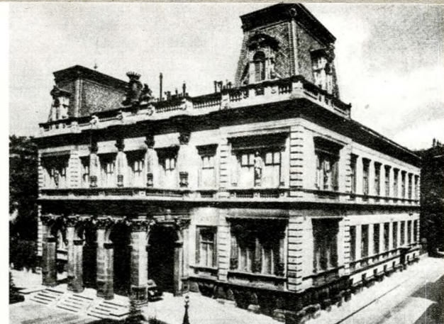
A Károlyi-palota. Pollack Mihály tér 3.