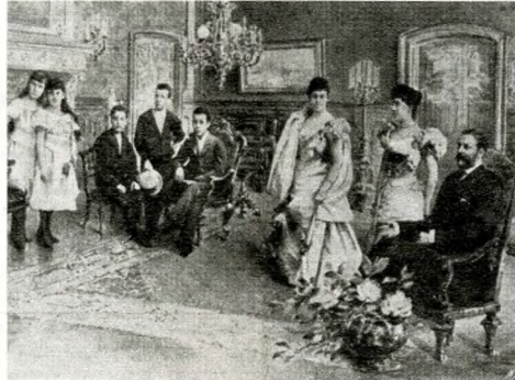
A Wenckheim család a dohányzó szobában. Ma a Szabó Ervin Könyvtár Budapest gyűjteménye, Szabó Ervin tér 1.