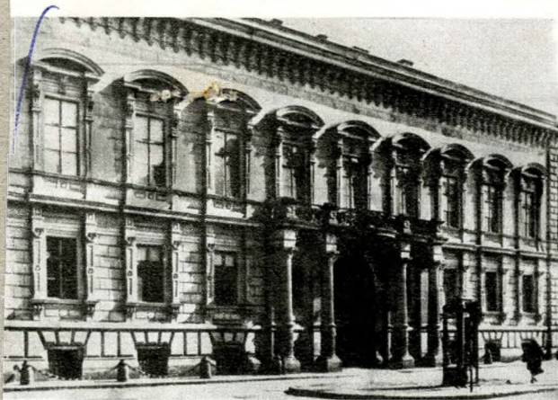
A Festetics-palota — ma az Országos Széchényi Könyvtár egyik részlege, Pollack Mihály tér 10.