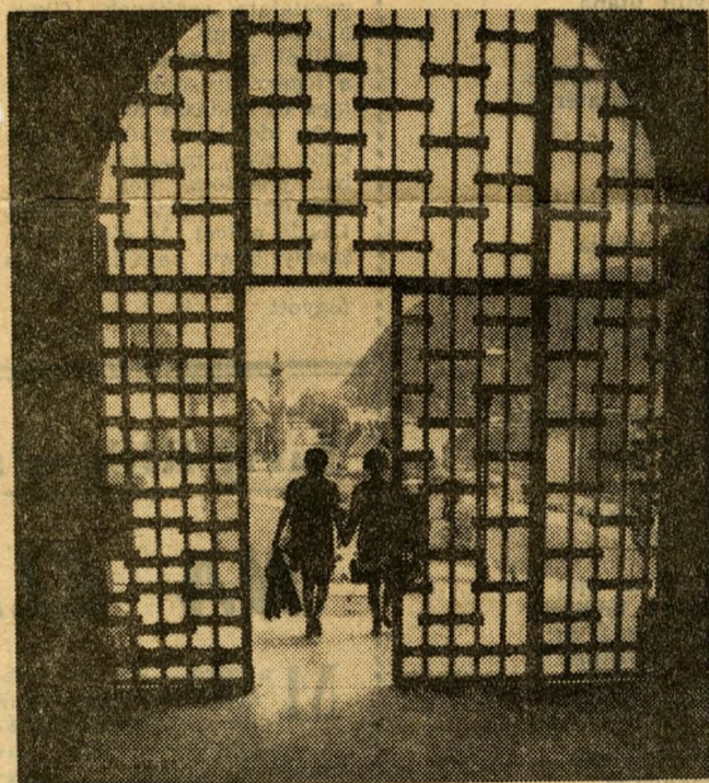
Modern vassrács az antik kapun. Itt léphet be a múzeumlátogató a középkorba is.

hogy nem rombolta az elődök munkáját. Ez a második a reneszánsz várpalota, s a kettőt együtt pusztította el a másfél évszázados török meg-