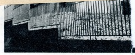
Óvoda a Tigris utcában

A hegyi részeken különleges problémákkal küzd a kerület az építkezések, tatarozások tekintetében. Nemcsak azért, mert egy műemléképület helyrehozatala a többszörösét teszi ki egy „közönséges” lakóház renoválási költségeinek, hanem azért is, mert a geológiai viszonyok, a márga- és mészkőtalaj rendszeresen igényli a támfalak karbantartását, megerősítését, olykor a sziklarobbantásokat. Emiatt a közművek bővítése, felvezetése is sok kínlódással, külön költséggel jár, az építkezések itt általában drágábbak az átlagnál. A tatarozások, kor-