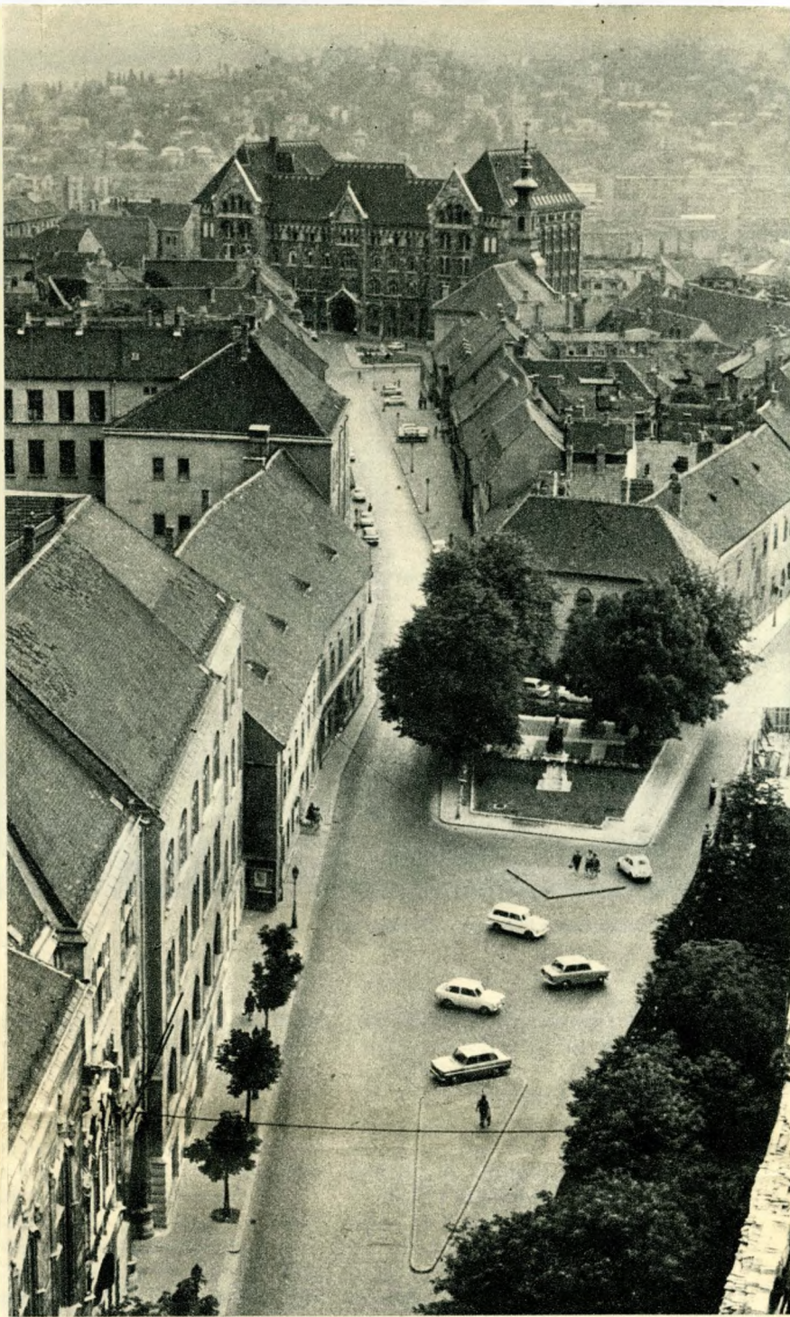
A Hess András tér

És mihez nem jut hozzá? Például a 16-os autóbushoz, legalábbis gyakran fél óra beletelik, mire begördül a macskaköves útvonalakra. Olcsó vendéglátóhelyekben sincs sok részük a várnegyedbeli bennszülötteknek és látogatóknak. Az Alabárdos, a Fortuna és más „menő” helyek, a Consumtourist-pavilonok alkotják a kereskedelem és a vendéglátás derékhátát errefelé. A közelmúlt adatai szerint húsz vendéglátó egység közül 14 az osztályú felüli vagy I. osztályú, és árnyékukban — pontosabban: fényükben — mindössze kilenc, jobbra kicsiny élelmiszerbolt húzódik meg. Ilyenformán a Hilton szálló