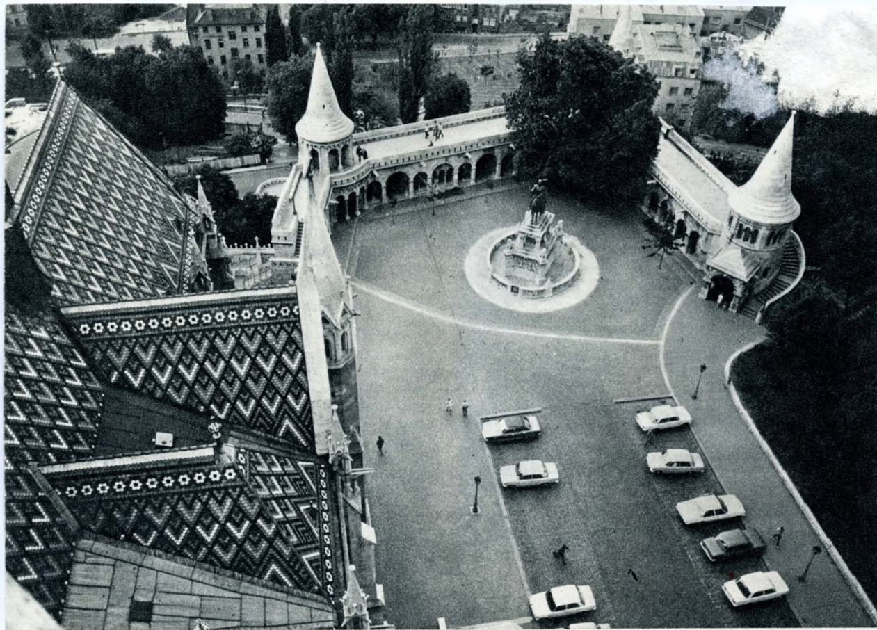
A Halászbástya — előtérben a Mátyás-templom tetőzete