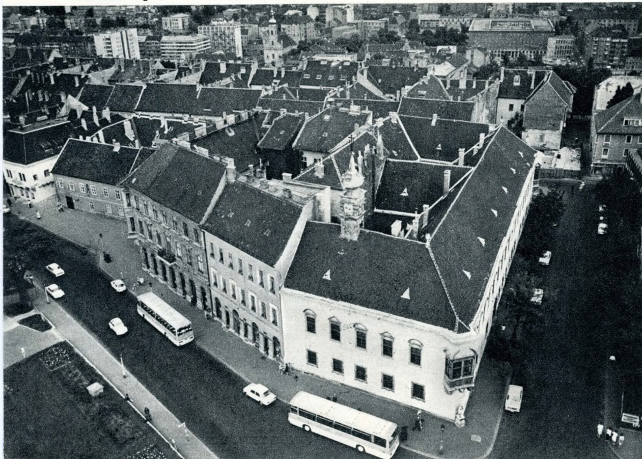
A Szentháromság tér — háttérben a Krisztinaváros

kerületnek alig-alig maradtak peremkerületi méretű, vertikális vagy horizontális beépítésre alkalmas tartalékterületei, fehér foltjai, következésképpen sohasem lesz belőle mammutkerület, „város szíve”, ipari negyed; múltja különben sem engedi be határai közé az élettér után tapogatózó urbanizációs csápokokat. Megmarad, mint a főváros ékszerdoboz.