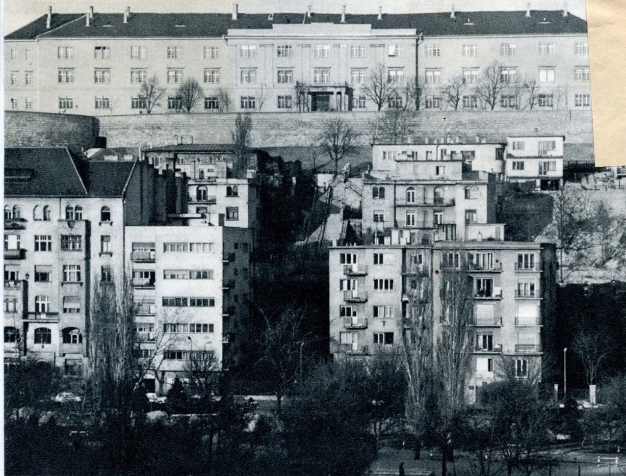
A Hadtörténeti Múzeum a Vérmező felől

niuk a lakosoknak a kerületből. Mindez természetesen elsősorban a közérrettel is gyengén ellátott naphegyieket sújtja, hiszen ők távolabb is, magasabban is laknak a Déli pályaudvar, az Alagút környékétől. A csarnok majdani újranyitása és a Május 1. Ruhagyár Fő utcai, ez évre tervezett üzlete talán már az idén segít valamelyest a gondokon, önmagában azonban még nem változtathat a kétes értékű statisztikai elsősegen: Budán az I. kerületben tolong a legtöbb vásárló egy négyzetméternyi üzletterületen. Viszont üdítő színfolt a kerületi kereskedelem hézagos mozaikjában a Gyorskocsi utcai, buda-