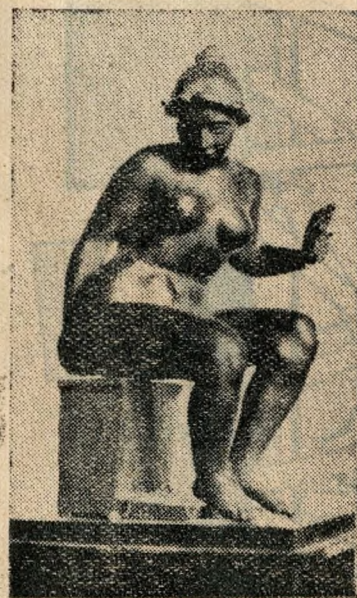
Maillol: Ülő női akt.

kerülnek bemutatásra Meunier-műve szerepel majd a kiállításon. Az ember nem tudja mit csodáljon jobban: a Bronz-korszak című allegorikus mű mozdulatában, mást keltő alkotásai. A Kikötő-arcában rejlő kifejező készséget vagy az Örök tavasz hófehér már-