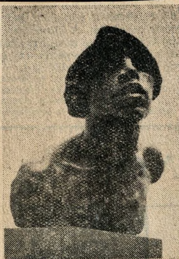
Meunier: Puddler (Kohómunkás).