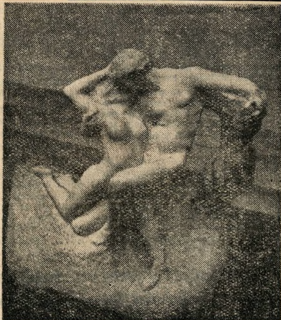
Rodin: Az örök tavasz.

negyedében készült. A bemutatott művek korok szobrászati természetének kiváló darabjai. Korunk szobrászóriásának Rodin-nek kerülnek bemutatásra Meunier-műve szerepel majd a kiállításon. Az ember nem tudja mit csodáljon jobban: a Bronz-korszak című allegorikus mű mozdulatában, mást keltő alkotásai. A Kikötő-arcában rejlő kifejező készséget vagy az Örök tavasz hófehér már-