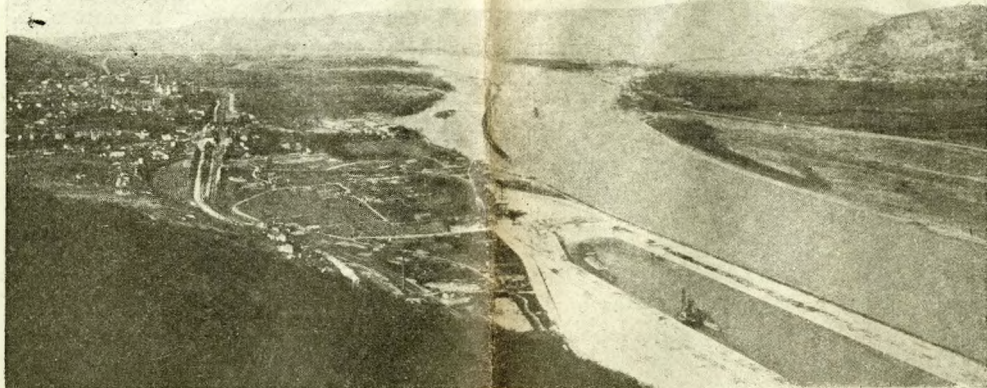
DA VIENNA A BUDAPEST LUNGO IL DANUBIO